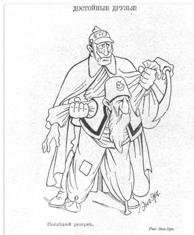
Рис. 3. «Достойные друзья!» Карикатура из газеты «Новое время». Художник Эн-Эр

Однако российские мусульмане заявили о своей лояльности царю [13, с. 196]. В то же время джихад задел чувства христианских народов Кавказа и Закавказья. Особенно рва-