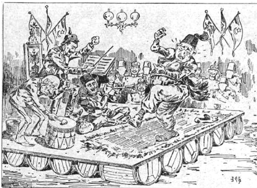
Рис. 1. «Танец на вулкане». Карикатура из газеты «Новое время». Художник Э. Сулиман-Грудзинский

Рисунок «Танец на вулкане» – одно из первых карикатурных изображений нового тройственного союза. В сатирической иконографии Первой мировой войны Кайзера всегда легко определить по огромным усам и остроконечному шлему. На фоне своих союзников он выглядит здоровым и крепким. Императора Австро-Венгрии обычно рисовали в виде выжившего из ума дряхлого старца с большой белой бородой, иногда тяжелораненого, с тростью, на костылях или в кресле-каталке. Султан (в феске или чал-