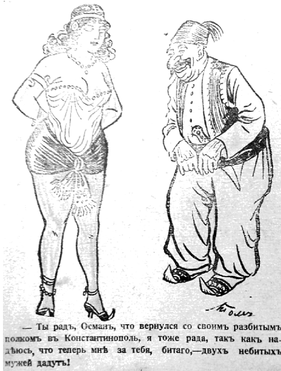
Рис. 4. «Разгром Турции». Карикатура из журнала «Стрекоза». Художник Алов

— Ты радъ, Османъ, что вернулся со своимъ разбитымъ полкомъ въ Константинополь, я тоже рада, такъ какъ надеюсь, что теперь мнѣ за тебя, битаго, — двухъ небитыхъ мужей дадутъ!