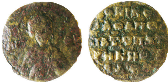
Рис. 1. Благотворительная тессера Николая, патрикия, анфипата и «скромного» эпарха из Музея исторических и культурных реликвий семьи Шереметьевых (Киев). Фото автора, 2012 Fig. 1. Charity tesserae of Nicholas, patrikios, anthypatos and ἐλάχιστος eparchos from the Sheremetievs Family Museum of Historical and Cultural Rarities (Kiev) (photo by the author, 2012)