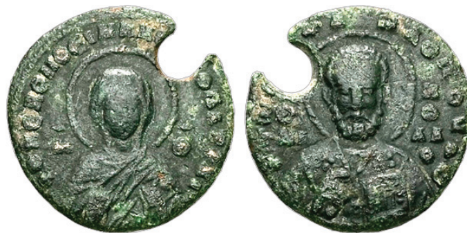
Рис. 4. Благотворительная тессера патрикия Николая Пентаилопулоса с аукциона Concordia Numismatic (по: [5, lot 803])

Fig. 4. Charity tesserae of Nicholas Pentailopoulos, patrikios from Auction Concordia Numismatic (according to [5, lot 803])