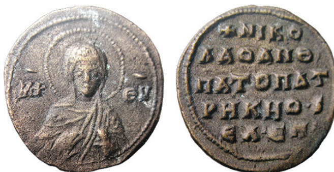
Рис. 2. Благотворительная тессера Николая, патрикия, анфипата и «скромного» эпарха из собрания Женевского музея искусств и истории (по: [3, p. 453, no. 397]) Fig. 2. Charity tesserae of Nicholas, patrikios, anthypatos and ἐλάχιστος eparchos from the Geneva Museum of Art and History (according to [3, p. 453, no. 397])