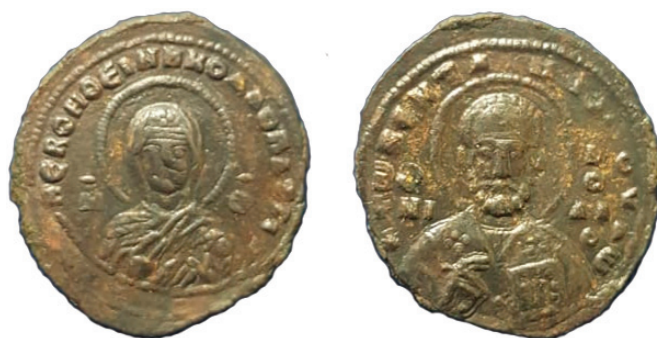
Рис. 3. Благотворительная тессера патрикия Николая Пентаилопулоса из Херсона. Fig. 3. Charity tessera of Nicholas Pentailopoulos, patrikios from Cherson