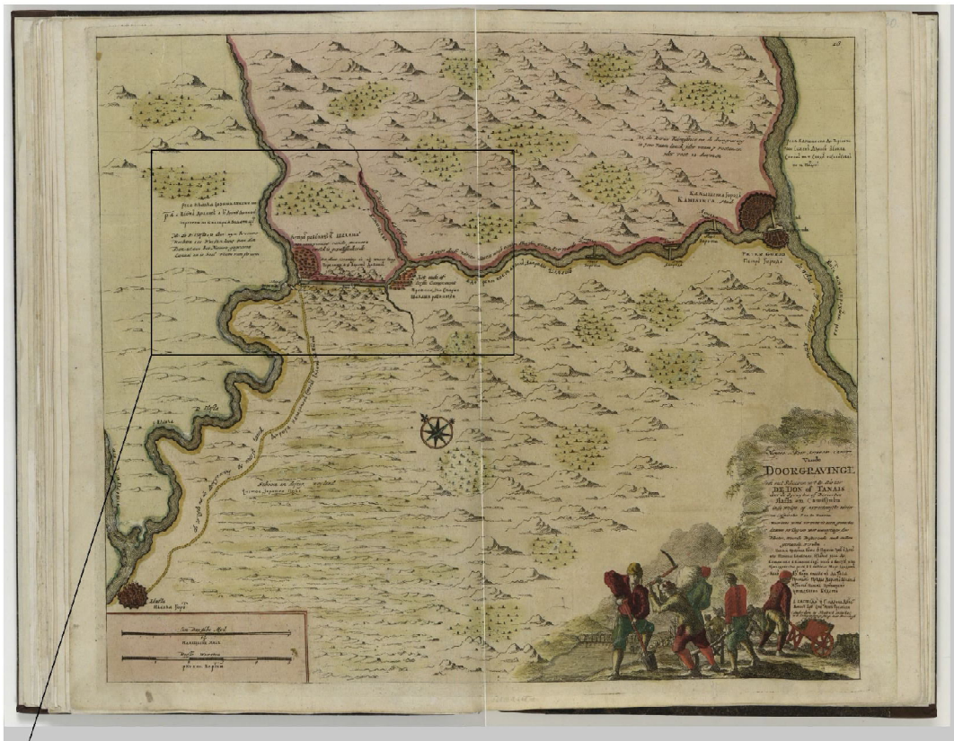
Рис. 4. Карта из атласа реки Дон Крюйса, 1704 г.