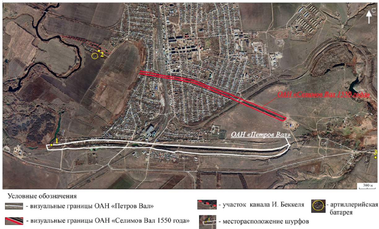
Рис. 1. Спутниковый снимок объектов археологического наследия «Селимов Вал 1550 год» и «Петров Вал».