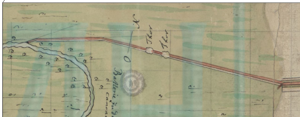
Рис. 3. Участок канала, где расположены объекты изучения (озера и артиллерийская батарея).