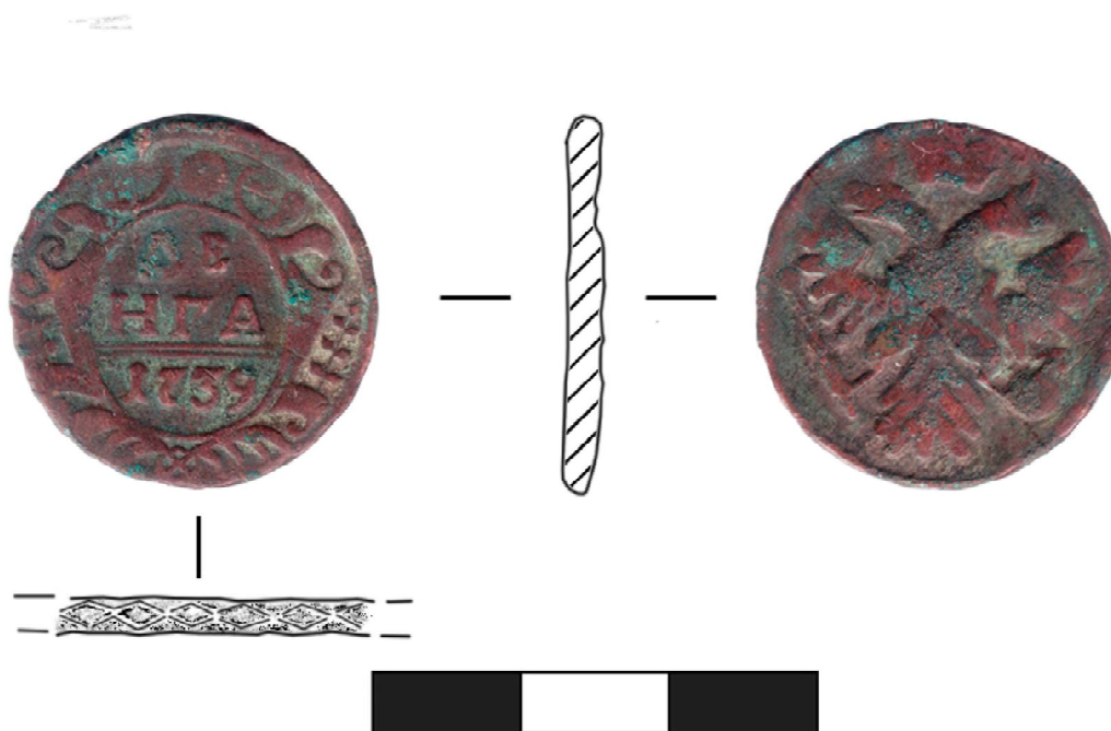
Рис. 7. Медная монета 1739 года (масштаб 1:1).