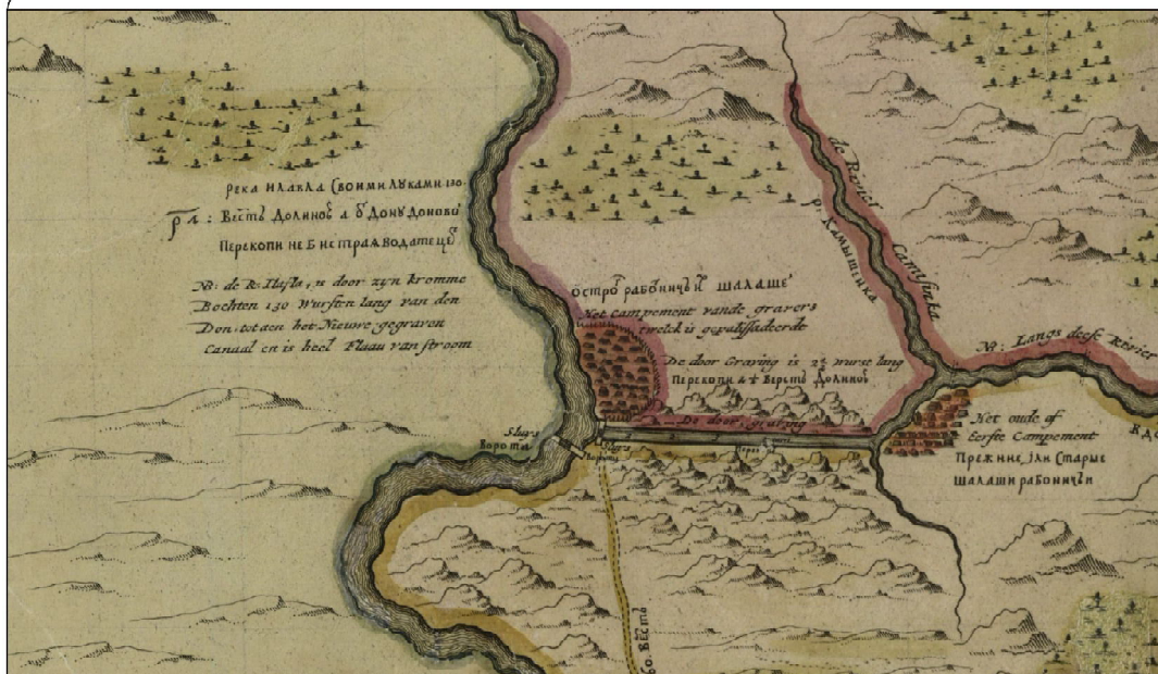
Рис. 5. Месторасположение рабочих лагерей строителей канала.

Рис. 4. Карта из атласа реки Дон Крюйса, 1704 год