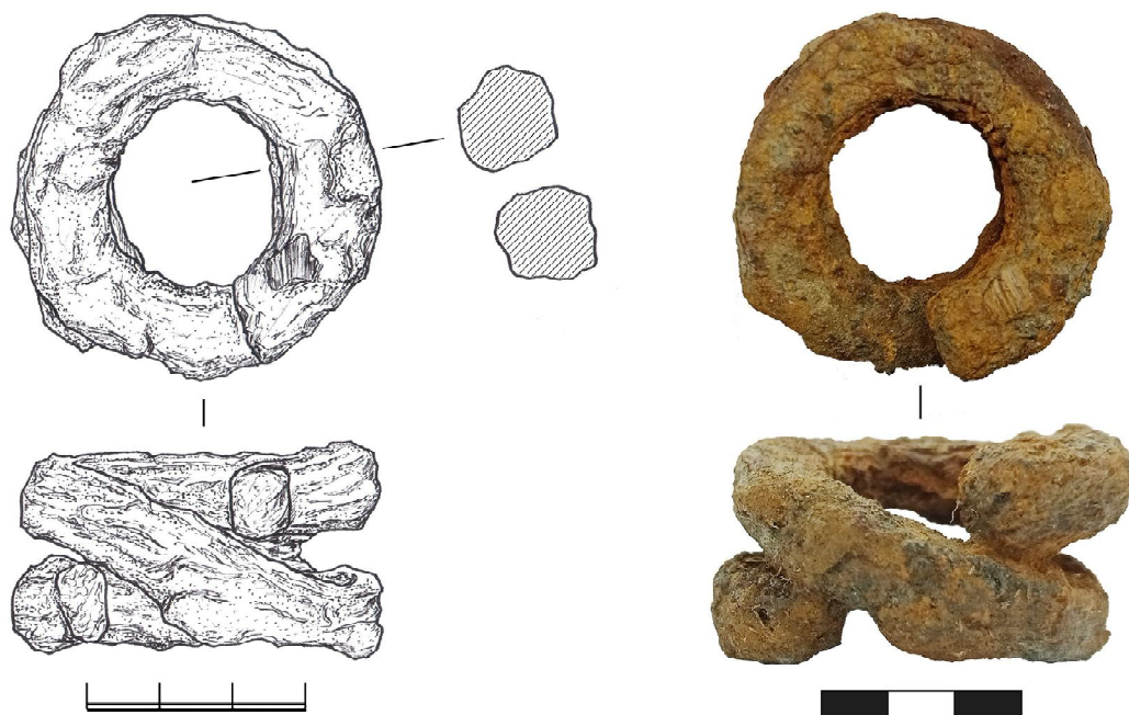
Рис. 6. Фрагмент кованного железного предмета (масштаб 1:1).