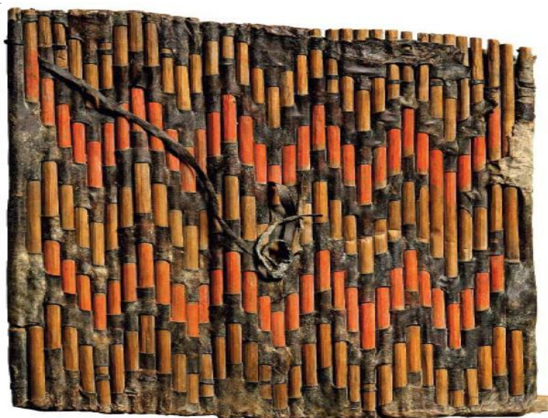
Рис. 7. Щит из кургана 1 Пазырыкского могильника. Раскопки М.П. Грязнова 1929 г. 3 Fig. 7. Shield from barrow 1 of the Pazyryk burial mound. Excavations by M.P. Gryaznov, 1929 3

Таким образом, скифские щиты представлены тремя основными типами. Для кон-