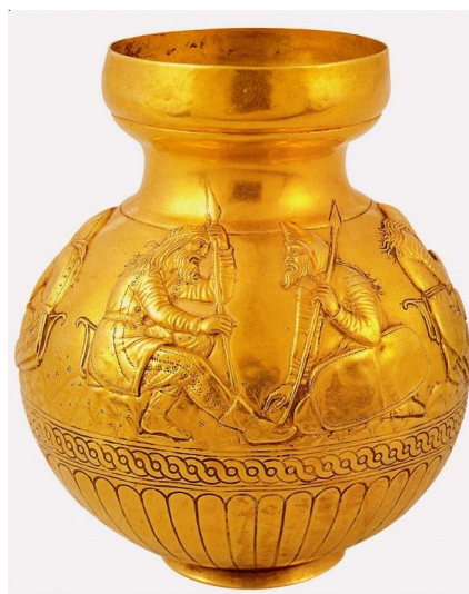
Рис. 3. Ваза из кургана Куль Оба Fig. 3. Vase from the Kul Oba barrow

Близкая форма овального щита встречается и без панцирного покрытия. На вазе из Куль Оба мы видим такой же овальный щит, но с простым кожаным покрытием (рис. 3). Воин с этим щитом не имеет на себе защитного доспеха. Сидит он на земле на коленях. Щит, по-видимому, деревянный, покрытый кожей, шерстью внутрь. Края щита подвернуты и прошиты стежками. Воин со щитом вооружен дротиком, как и всадник на солохском гребне. Но на рассматриваемом экземпляре отсутствуют втулки и прорезь в боковой стене, как на спинном щите всадника солохского гребня. Такой же щит держит в руке пеший воин без доспеха на солохском гребне (см. рис. 2). Это дает нам основание предполагать, что данная форма щита использовалась пешими воинами. Такой щит был снабжен двумя параллельными ручками с внутренней стороны, которые удерживались кистью левой руки (см. рис. 2, б). Этот щит, как и спинной, располагался длинной стороной горизонтально, надежно прикрывая верхнюю часть тела. Небольшая ширина щита обеспечивала хороший обзор из-за прикрытия, но оставляла незащищенной нижнюю часть туловища и ноги. Впрочем, следует полагать, что движения предплечьем левой руки предпола-