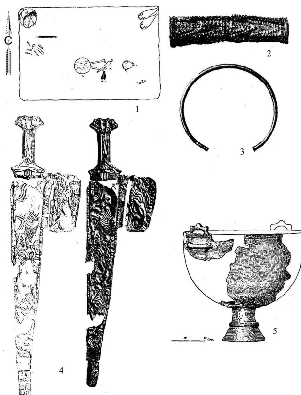
Рис. 1. Материалы из раскопок А.А. Миллера:

1 – план погребения из кургана 10; 2 – золотая пронизка; 3 – золотая гривна; 4 – меч в ножнах; 5 – бронзовый котел