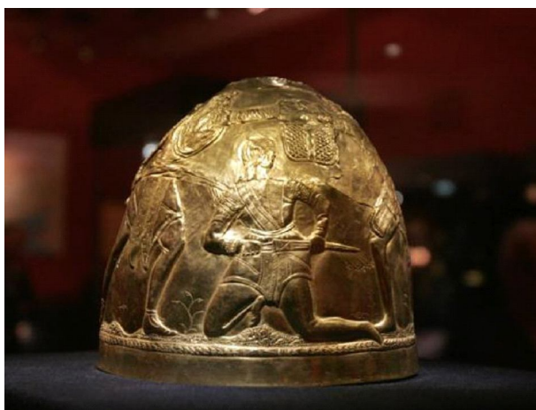
Рис. 5. Тиара из Передериевой Могилы Fig. 5. Tiara from the Perederieva Grave

Плетеные щиты. Особую категорию щитов, известных по письменным источникам, составляют плетеные щиты. Этот редкий конструктивный тип, по-видимому, изображен на тиаре из Передериевой Могилы (рис. 5). Он небольшой, почти квадратный, со скругленными углами. Сам щит комбинированный: его верхняя часть изготовлена, по-видимому, из цельной доски, покрытой кожей, а нижняя часть представлена кожаным фартуком, укрепленным лозой (рис. 6). Этот тип щитов бла-