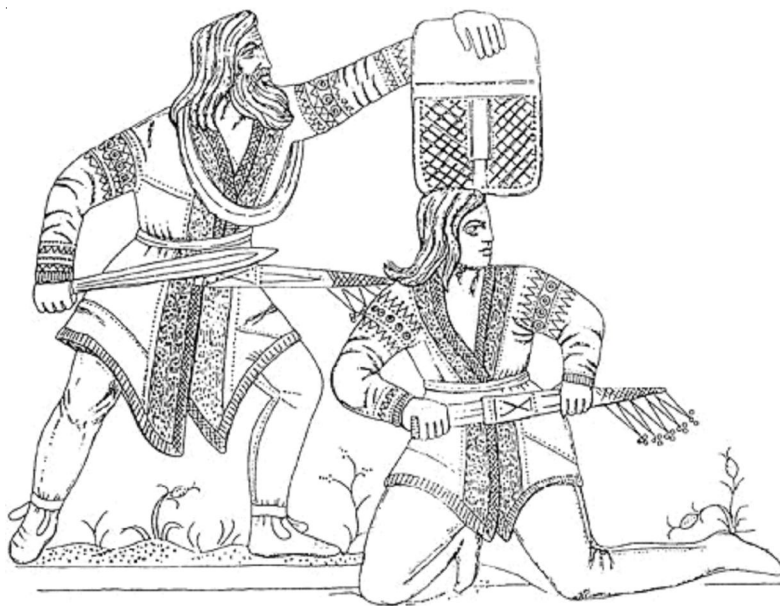
Рис. 6. Прорисовка сюжета на тиаре из Передериевой Могилы Fig. 6. Drawing the plot on the tiara from the Perederieva Grave