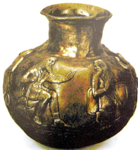
Рис. 4. Ваза из Частых курганов Fig. 4. Vase from the Chasty barrows

Итак, в скифском доспехе присутствуют чешуйчатые спинные щиты, функции которых были двойными: они защищали всадника во вре-