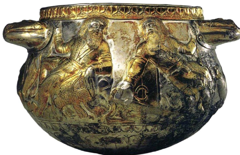
Рис. 8. Чаша из Гаймановой Могилы Fig. 8. Bowl from the Gaimanova Grave