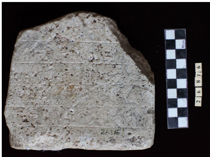
Рис. 6. Алтарь с изображением жертвоприношения быка (г. Ставрополь) – оборотная сторона

Во втором случае это детали иранского костюма, особенности окладистой бороды (у правой фигуры), а также изображения характерных для Востока солярных и лунарных символов, знаков священных животных и др.