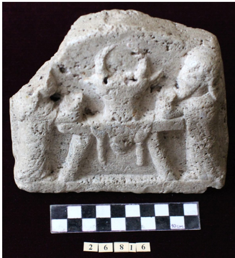
Рис. 3. Алтарь с изображением жертвоприношения быка (г. Ставрополь) – лицевая сторона (вид сверху)