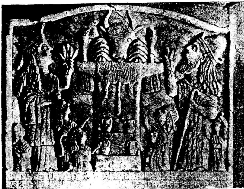
Рис. 7. Алтарь с изображением жертвоприношения быка V в. н. э. (по Г. Капанцян, Армения)

То же наблюдается с левой стороны, где с венцом на голове изображена царица, подносящая жертвенному быку такой же пучок из пяти колосьев, а группа дочерей (их также три) показана с приподнятыми левыми руками. Они, видимо, только что поставили на ступеньки алтаря сосуды с напитком (?). На ступеньках выставлены четыре таких сосуда, по два с каждой стороны. Царь держит в левой руке посох с загнутым кверху концом.