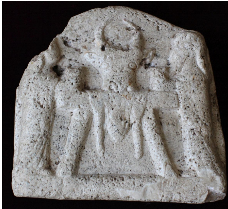
Рис. 2. Алтарь с изображением жертвоприношения быка (г. Ставрополь) – лицевая сторона