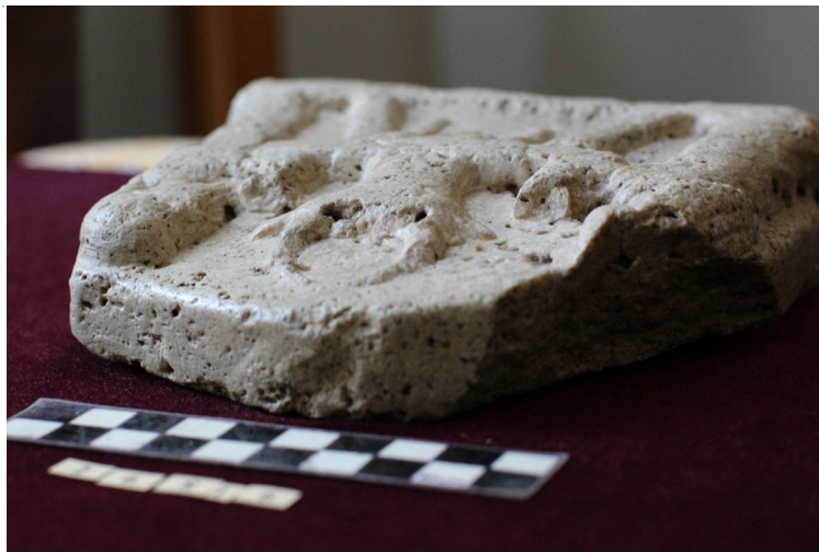
Рис. 4. Алтарь с изображением жертвоприношения быка (г. Ставрополь) – лицевая сторона (вид справа)

Вторая строка занимает пространство между выступающими фрагментами шкуры (конечностей) – «ΘΙΠΣ».