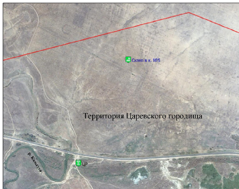
Рис. 3. Место предполагаемого расположения склепа, раскопанного А.В. Терещенко (на космоснимке участка Царевского городища)