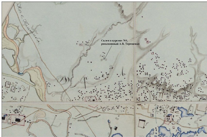
Рис. 2. Место предполагаемого расположения склепа, раскопанного А.В. Терещенко в 1843 г. (на плане Н.К. Тетеревникова)

ти показал правильность предположения о локализации склепа, раскопанного А.В. Терещенко. На месте старого раскопа сейчас располагается сильно запывшая яма размерами примерно 10 × 15 м и глубиной около 0,5 метра. Вокруг ямы фиксируются объекты, расположенные примерно также, как они изображены на плане Н.К. Тетеревникова. Они полностью распаханы, но их можно найти по траве, которая отлична от растительности вне объектов. На