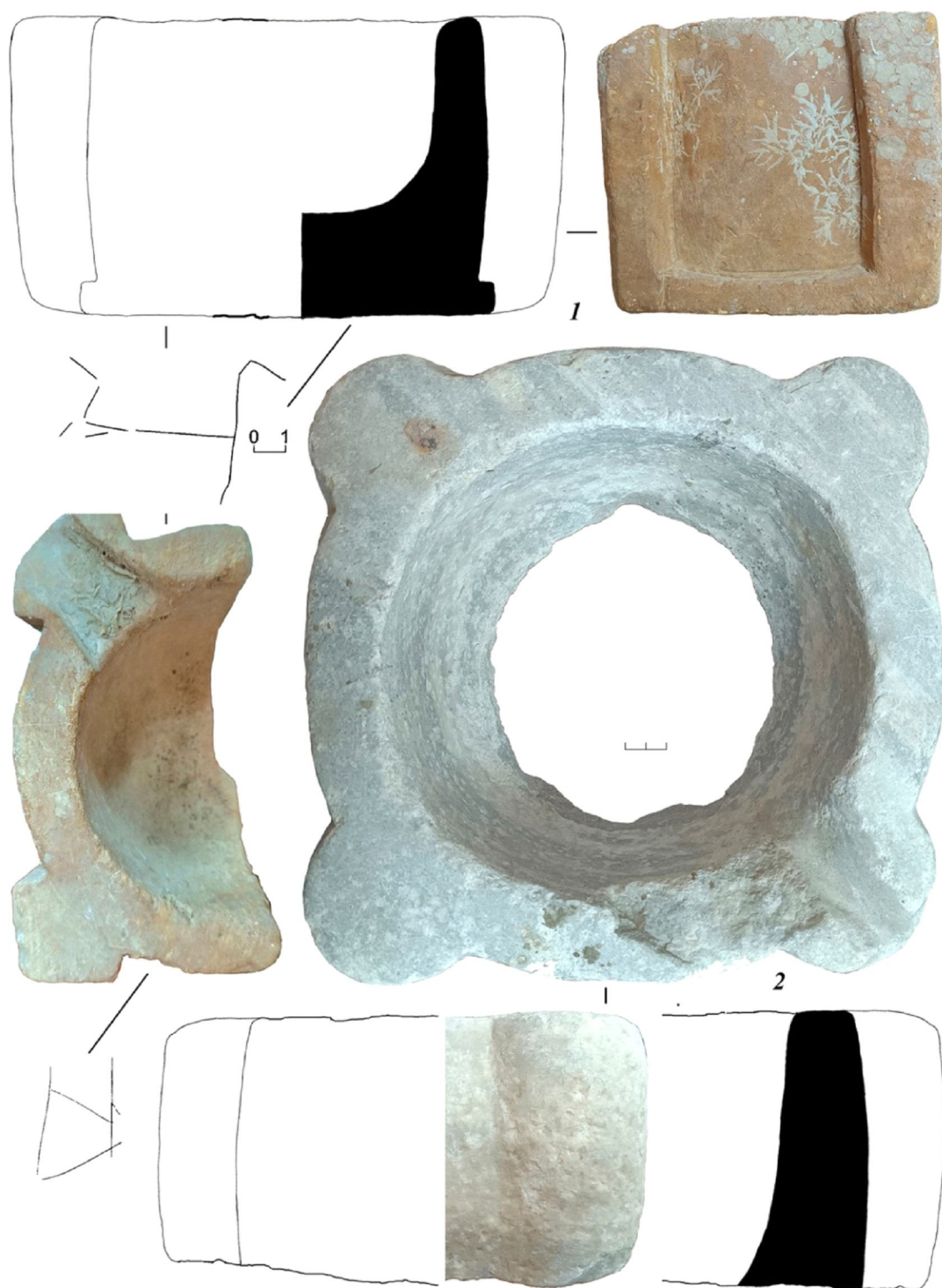
Рис. 5. Византийские мраморные ступки Сугдеи:

1 – Новый Свет, 2002 г., участок 1, шурф 5 (МЗСК КП-753); 2 – подъемный материал (МЗСК КП-293)