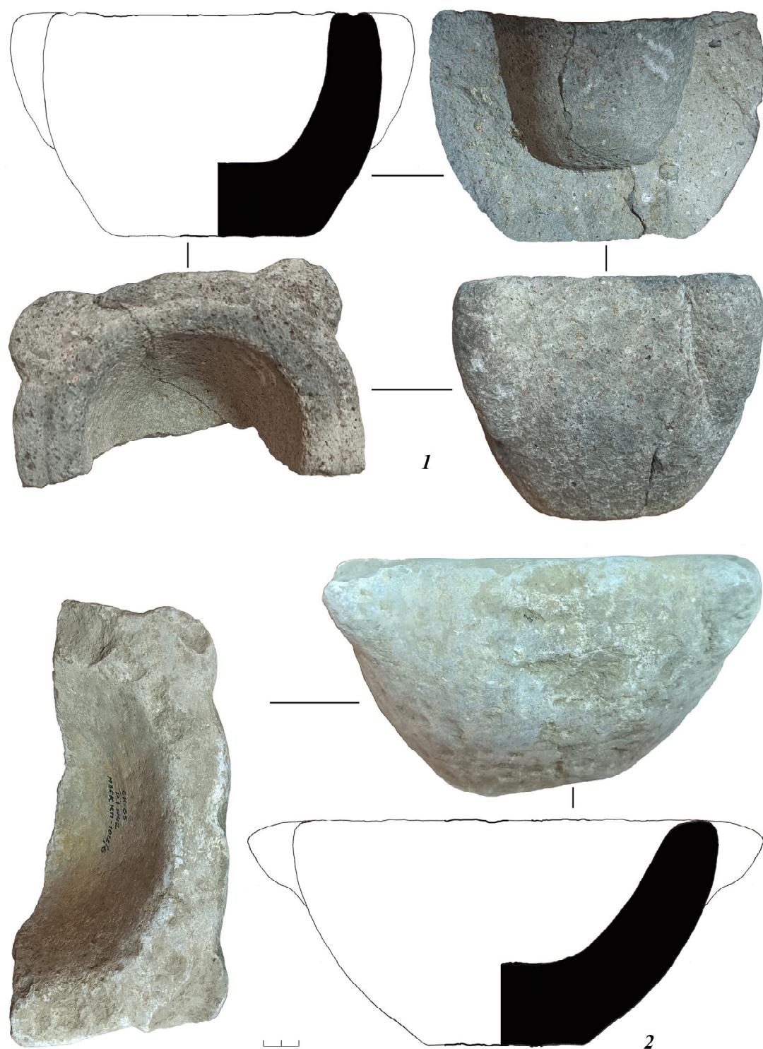
Рис. 3. Византийские мраморные ступки Сугдеи:

1 – портовая часть, раскоп VIII, 2014 г. (МЗСК КП-323); 2 – портовая часть, раскоп I, 1965 г., слой середины – второй половины XIII в. (МЗСК КП-1012/6)