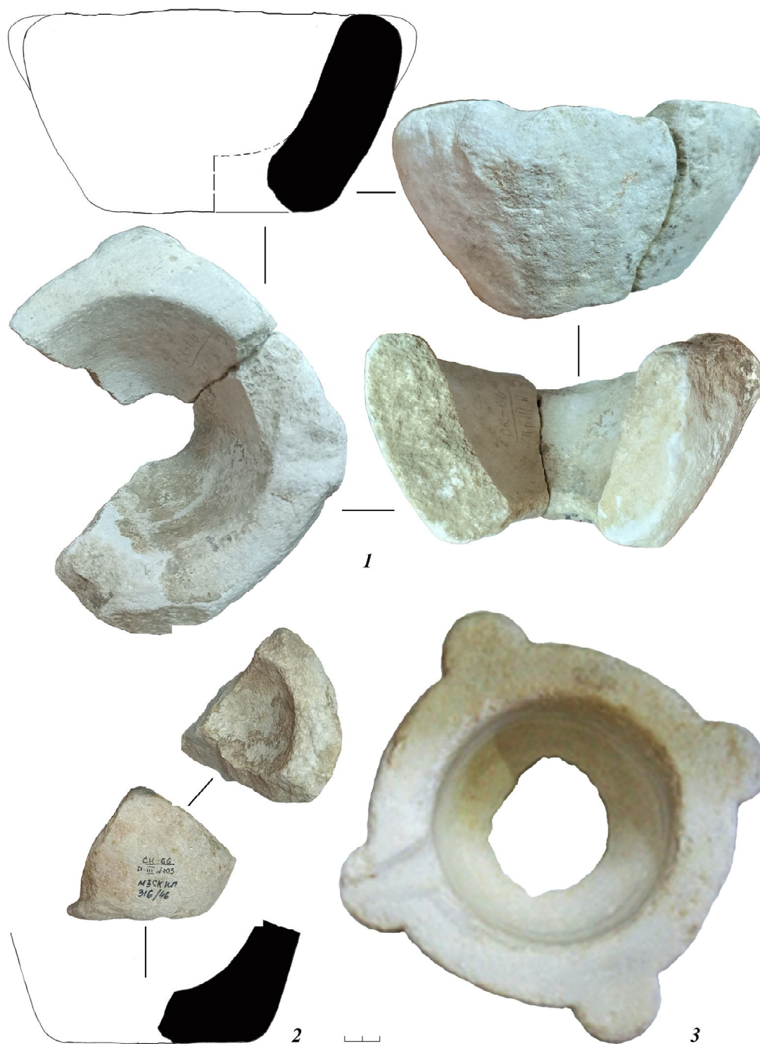
Рис. 4. Византийские мраморные ступки Сугдеи:

1, 2 – портовая часть, раскоп III, 1966 г., слой середины – второй половины XIII в. (МЗСК КП-316/142); 3 – подъемный материал (МЗСК КП-176)