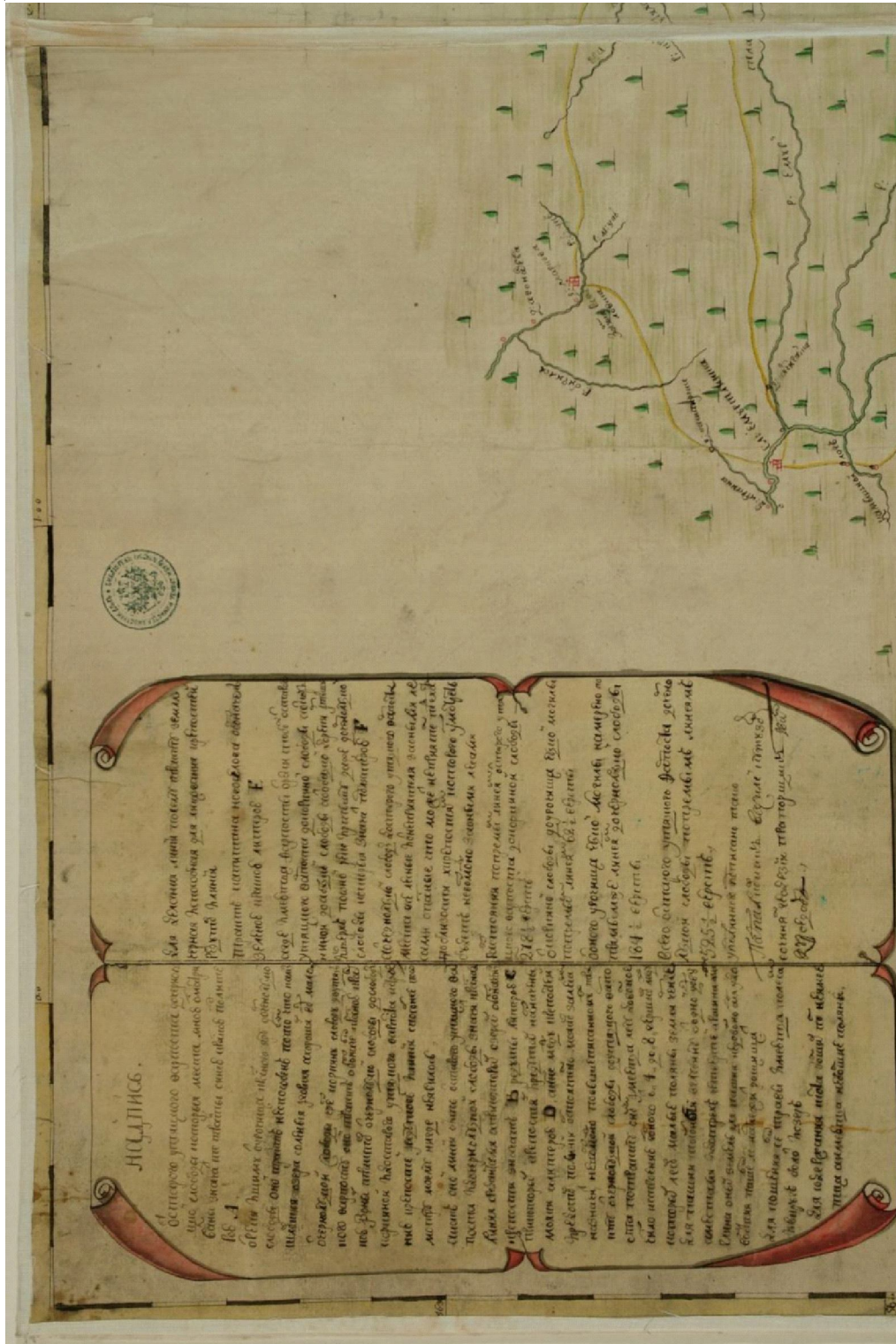
Рис. 2. Карта Сибирской губернии от старого Утятского форпоста до реки Иртыша и до Чернолуцкой слободы... («Карта Василия Кутузова 1745 г.»), фрагмент с картушем Fig. 2. Map of the Siberian province from the old Utyatsky outpost to the Irtysh River and to the Chernolutskaaya settlement... («Vasily Kutuzov's map of 1745»), fragment with cartouche