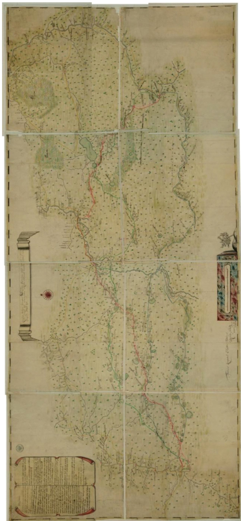
Рис. 3. Карта Сибирской губернии от старого Утяцкого форпоста до реки Иртыша и до Чернолуцкой слободы... («Карта Василия Кутузова 1745 г.»), общий вид