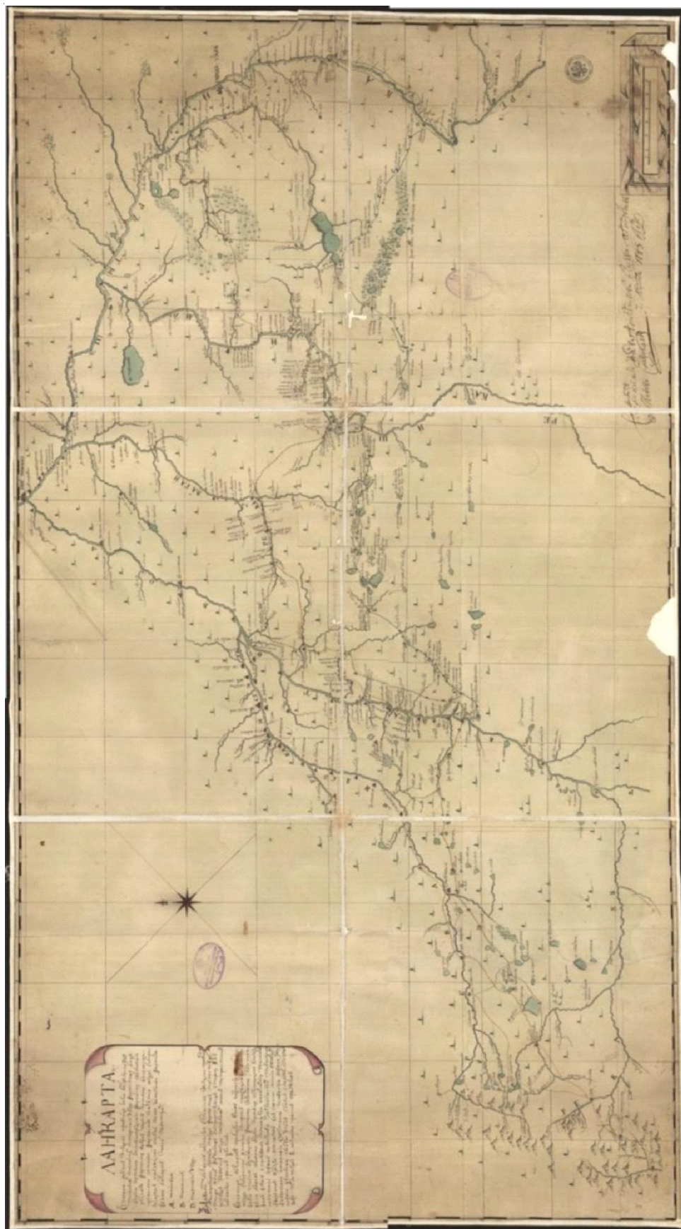
Рис. 1. Ландкарта. Описание мест Исетской провинции... («Карта капитана Новоселова 1743 г.»), общий вид Fig. 1. Map. Description of places in the Isetskaya province... («Captain Novoselov's map of 1743»), general view