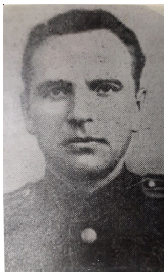
Рис. 4. Г.Л. Северский (1909–1997 гг.). Подполковник – начальник 3-го партизанского района Крыма, заместитель А.В. Мокроусова, руководителя партизанским движением в Крыму. В 1942 г. Г.Л. Северский возглавил Штаб партизанского движения Крыма (Официальный сайт Государственного каталога музейного фонда Российской Федерации. URL: https://goskatalog.ru/portal/#/collections?id=26537488 )