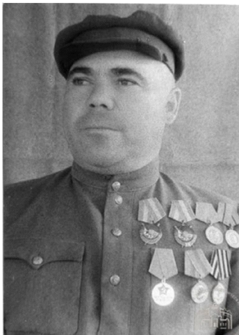
Рис. 6. М.А. Македонский (1904–1971 гг.). Командир Южного соединения партизан Крыма в годы Великой Отечественной войны (URL: https://goskatalog.ru/portal/#/collections?id=27760398 )