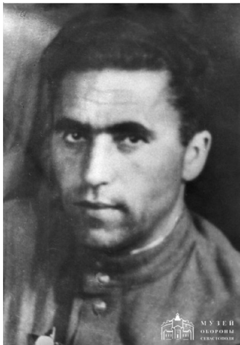
Рис. 5. Х.К. Чусси (1909–1973 гг.). Командир 4-й бригады Южного соединения партизан Крыма в 1941–1944 гг.