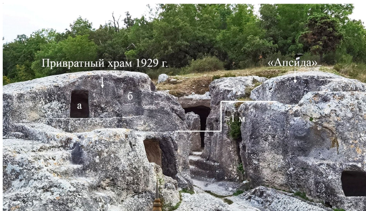
Рис. 3. Предвратные сооружения на Эски-Кермене: а – усыпальница № 68; б – ниша протесиса (фото автора, 2022 г.) Fig. 3. The structures outside the town gate on the Eski-Kermen: а – tomb no. 68; б – prothesis niche (photo by the author, 2022)