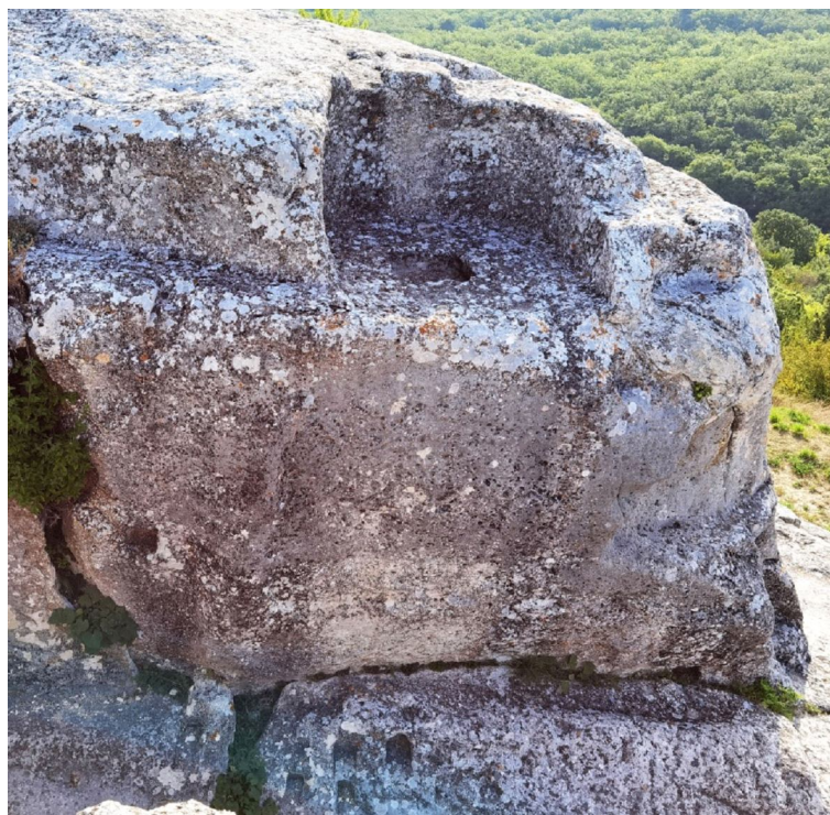
Рис. 2. Закругленная вырубка в скале или так называемая апсида Fig. 2. The rounded carved pit or so-called apse