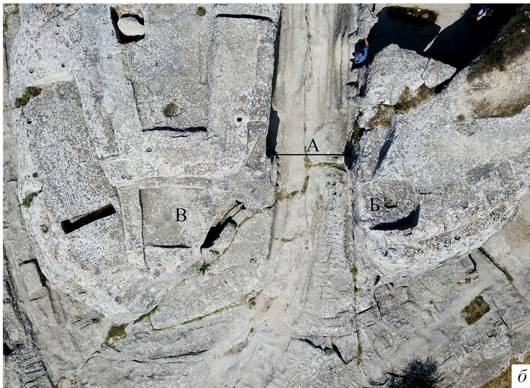
Рис. 1. Территория вокруг главных ворот на Эски-Кермене:

а – план 1929 г. (на основе публикации: [14, с. 180, рис. 2]); А – линия ворот; Б – закругленная вырубка в скале; В – остатки храма на западной площадке; а – усыпальница № 68; б – вид сверху