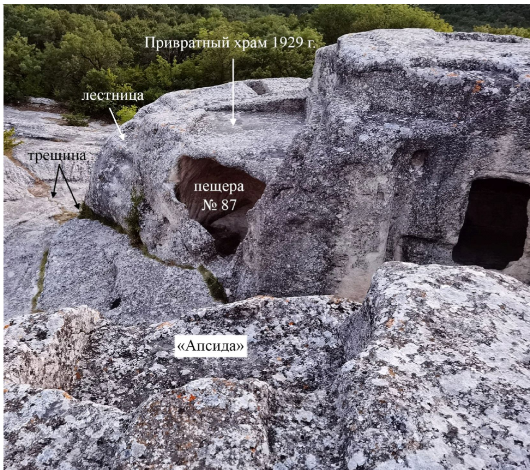
Рис. 4. Предвратные сооружения на Эски-Кермене. Вид на западный скальный выступ со стороны закругленной вырубki («апсиды») (фото автора, 2023 г.)