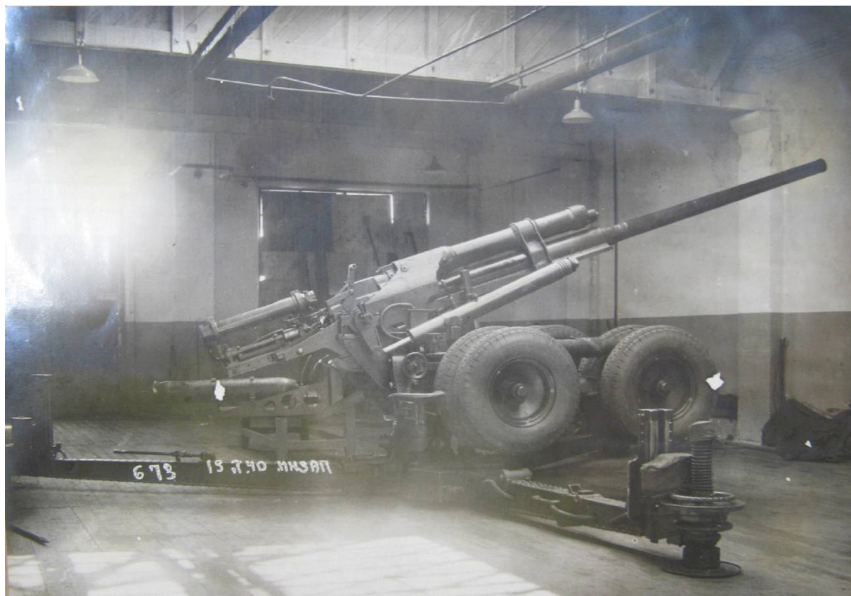
100-мм зенитная пушка Л-6 Кировского завода конструкции И.А. Маханова 100-mm anti-aircraft gun L-6 of the Kirov plant, designed by I.A. Makhanov