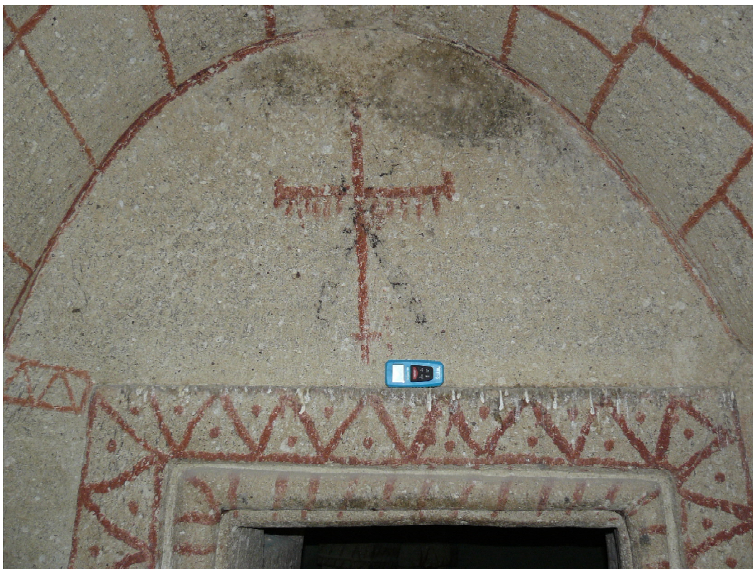
Рис. 3. Нижний ярус. Вход в нартекс. Храм с колоннами. Гереме. Fig. 3. Lowerstorey. Entrancetothearthex. The church with columns. Göreme.