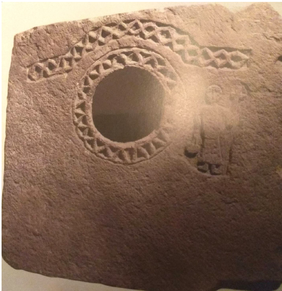
Рис. 10. Фасад церкви в Мушевани [21, ill. 188] Fig. 10. Façade of the church in Muşevani [21, ill. 188]