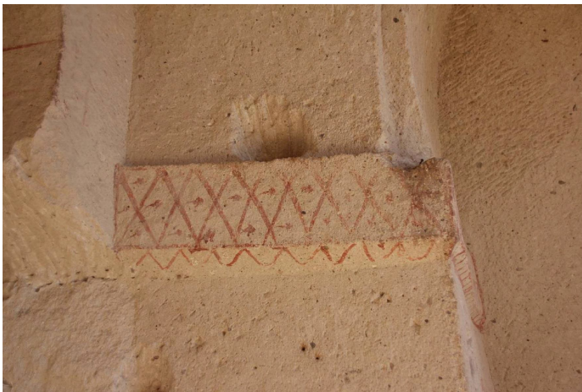
Рис. 1. Неф верхнего яруса. Храм с колоннами. Гереме. Fig. 1. Nave of the upper storey. Church with columns. Göreme.