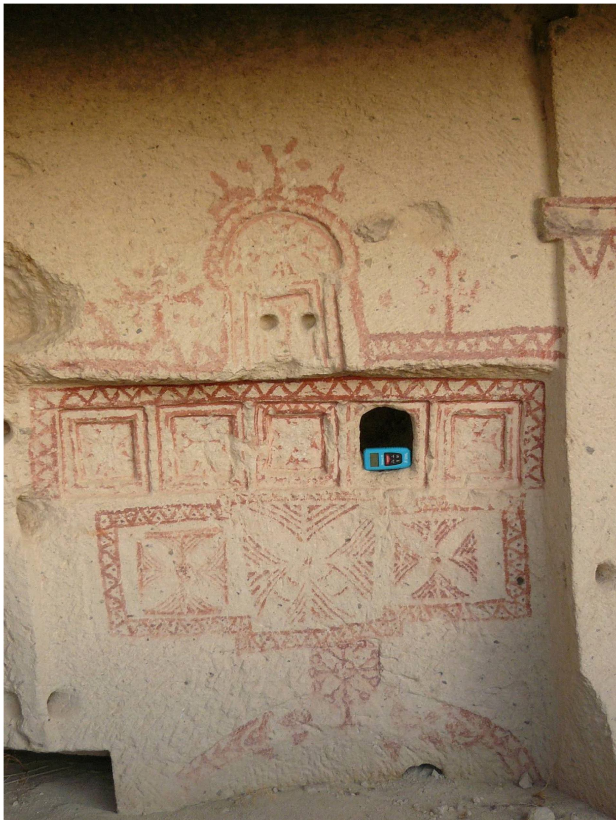
Рис. 5. Частично разрушенный культовый объект. Долина Киличлар. Гереме. Fig. 5. Partly damaged cult object. Kiliçlar valley. Göreme.