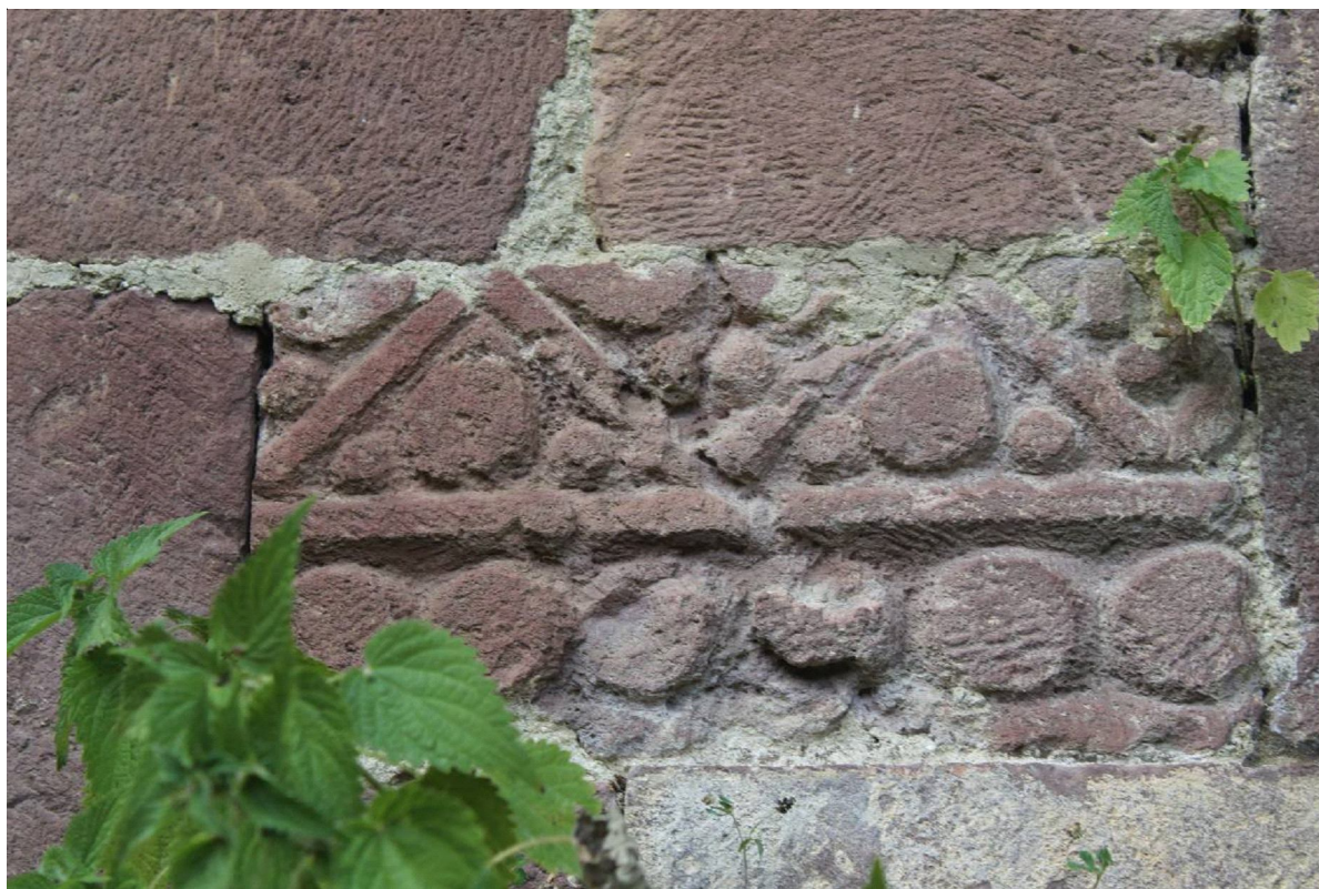
Рис. 13. Резной блок, вмурованный в стену заброшенной школы. Касагина. Fig. 13. Carved block embedded to the wall of an abandoned school. Kasagina.