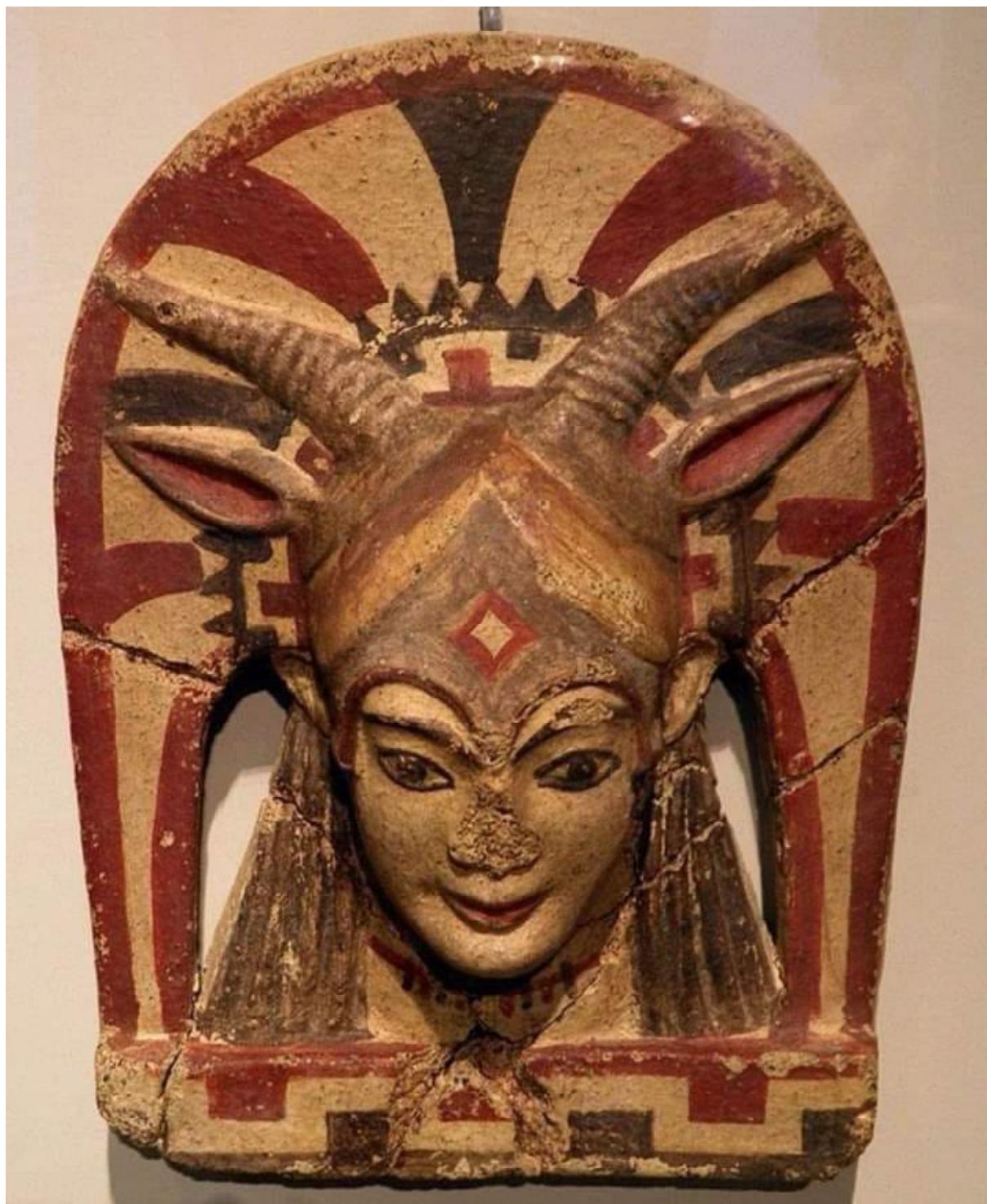
Рис. 15. Этресская богиня Ватика. Старый Музей в Берлине