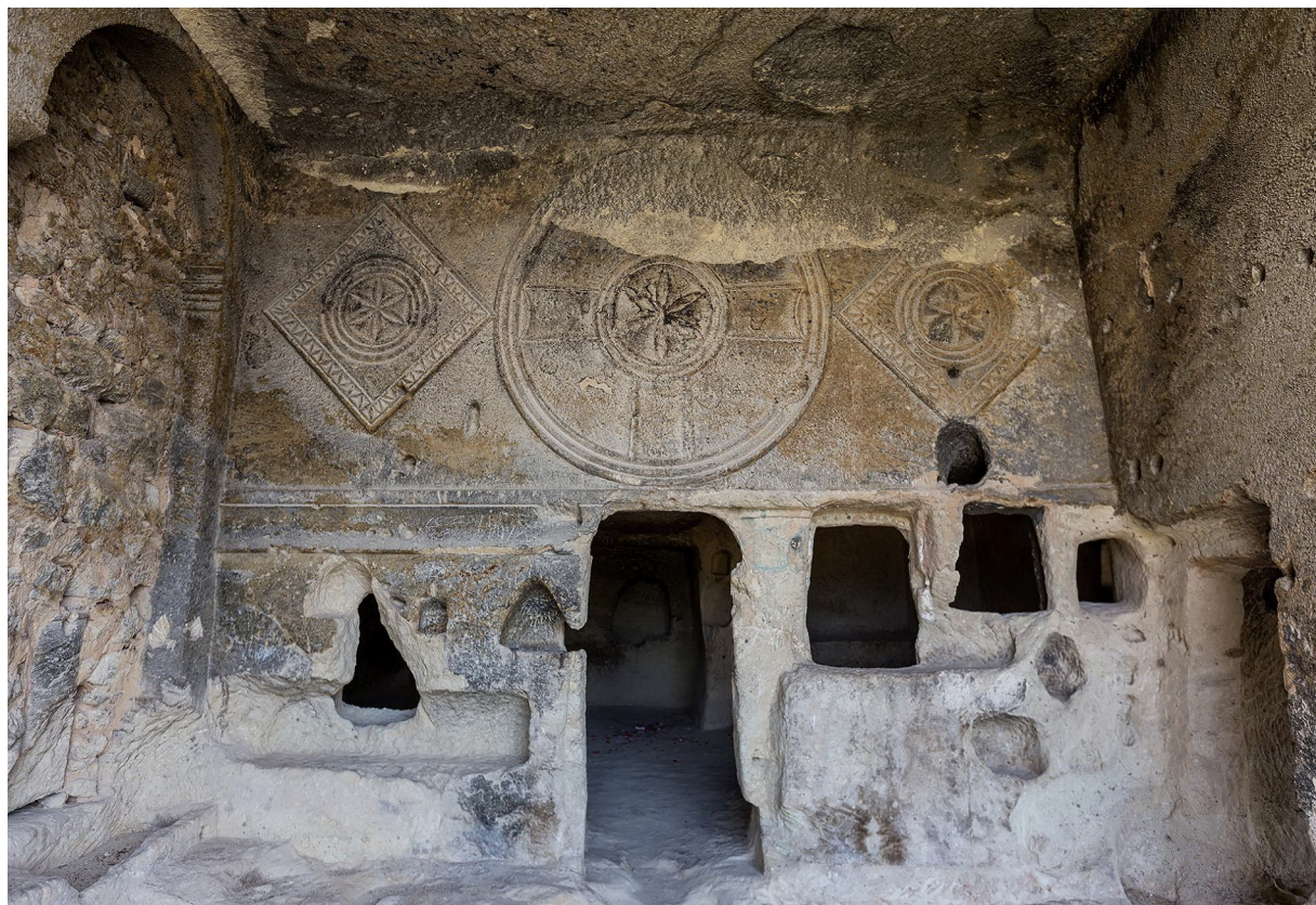
Рис. 8. Западный вход. Церковь в Чавушине. Fig. 8. Western entrance. The church in Çavuşin.