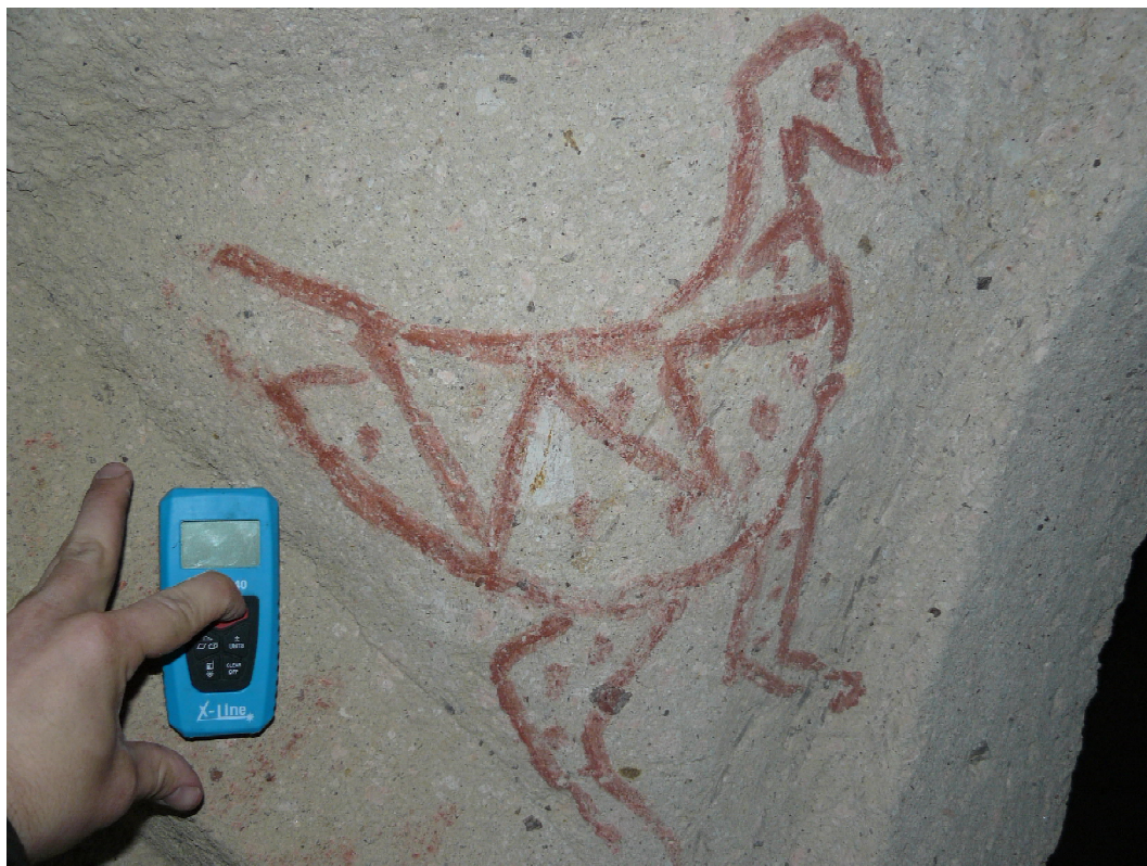
Рис. 6. Частично разрушенный культовый объект. Долина Киличлар. Гереме. Fig. 6. Partly damaged cult object. Kiliçlar valley. Göreme.