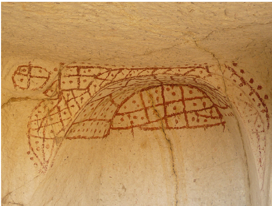
Рис. 4. Культурный объект из долины Киличлар. Гереме. Fig. 4. Cult object from Kiliçlar valley. Göreme.