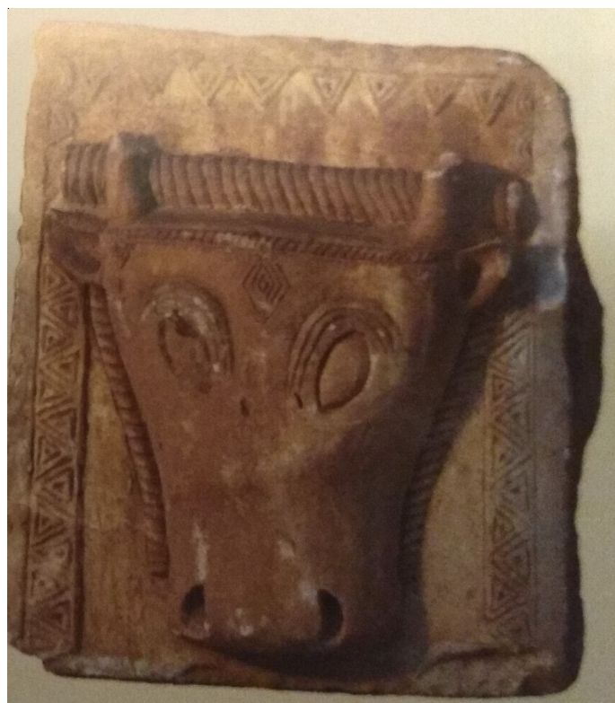
Рис. 9. Плита из Джегеты, Сванетия [21, ill. 303] Fig. 9. Block from Djegeta. Svanetia [21, ill. 303]