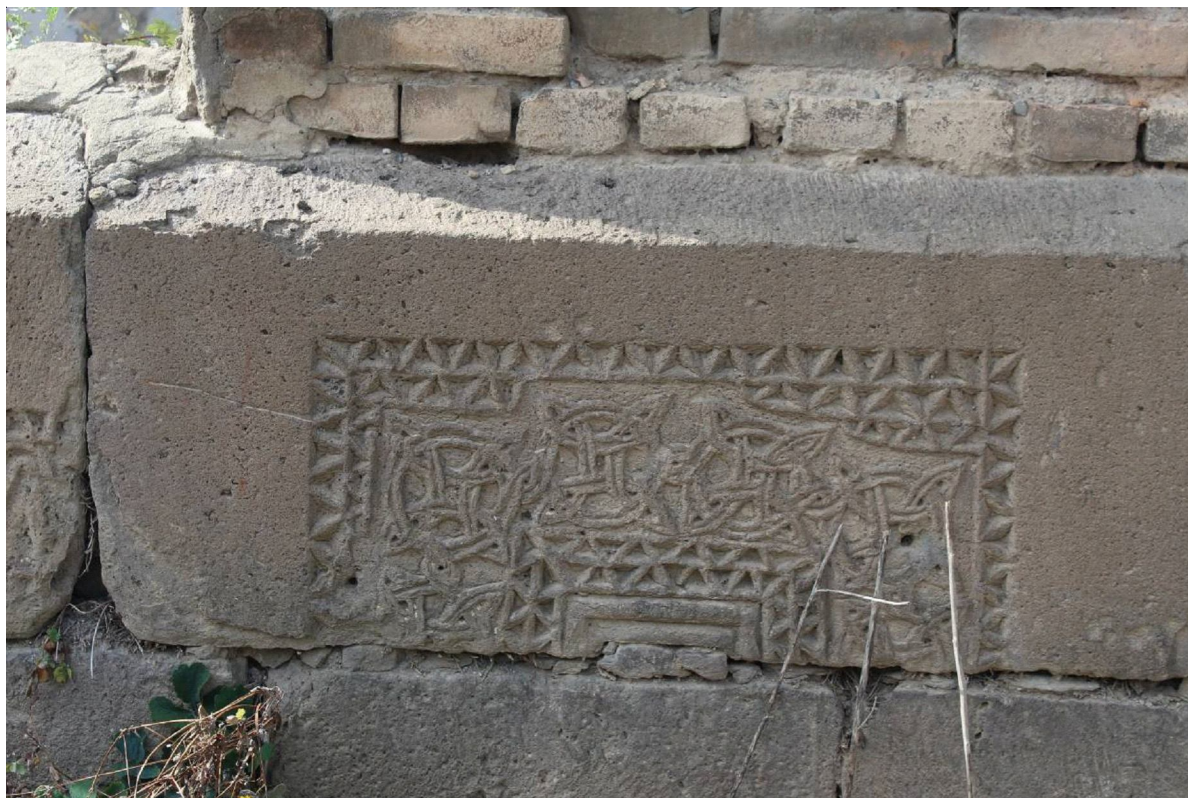
Рис. 12. Плита из Тбета. Вмурована в стену больницы. Г. Цхинвал. Fig. 12. Block from Tbet. Embedded to the wall of a hospital. Tskhinval.