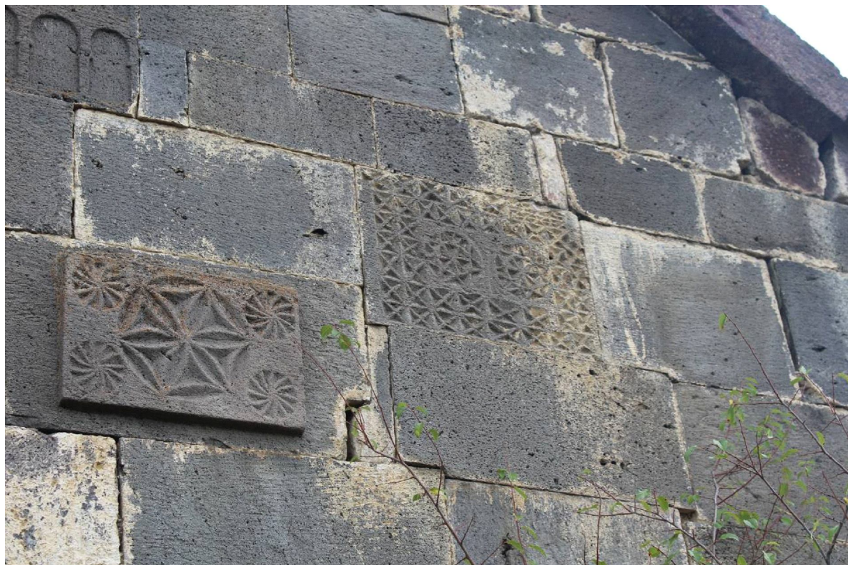
Рис. 14. Резной блок. Южный фасад церкви в Дисеве. XVIII–XIX вв. Fig. 14. Carved block. Southern façade of the church in Disev, 18 th –19 th cc.