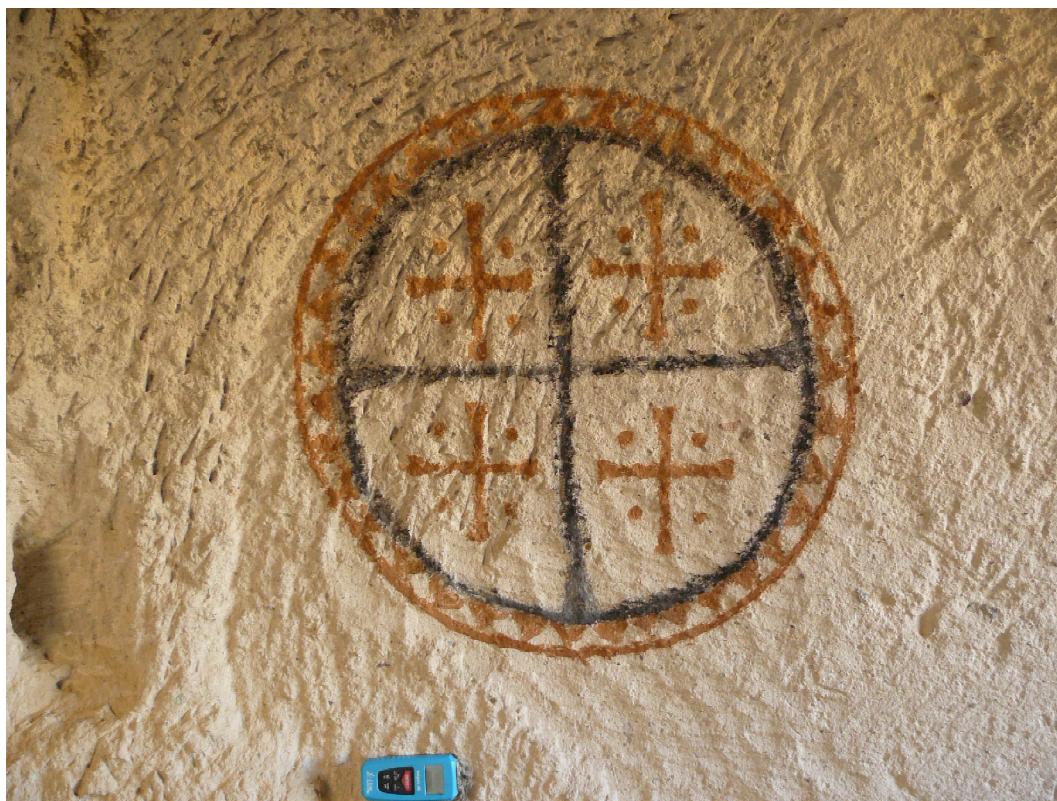
Рис. 7. Частично разрушенный культовый объект. Долина Киличлар. Гереме. Fig. 7. Partly damaged cult object. Kiliçlar valley. Göreme.