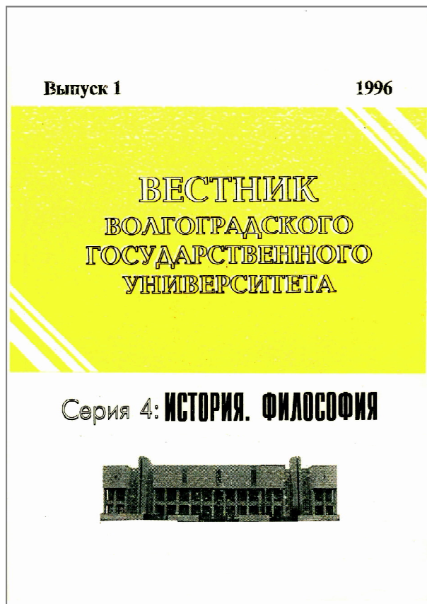
Рис. 1. Обложка журнала в период с 1996 по 2000 год