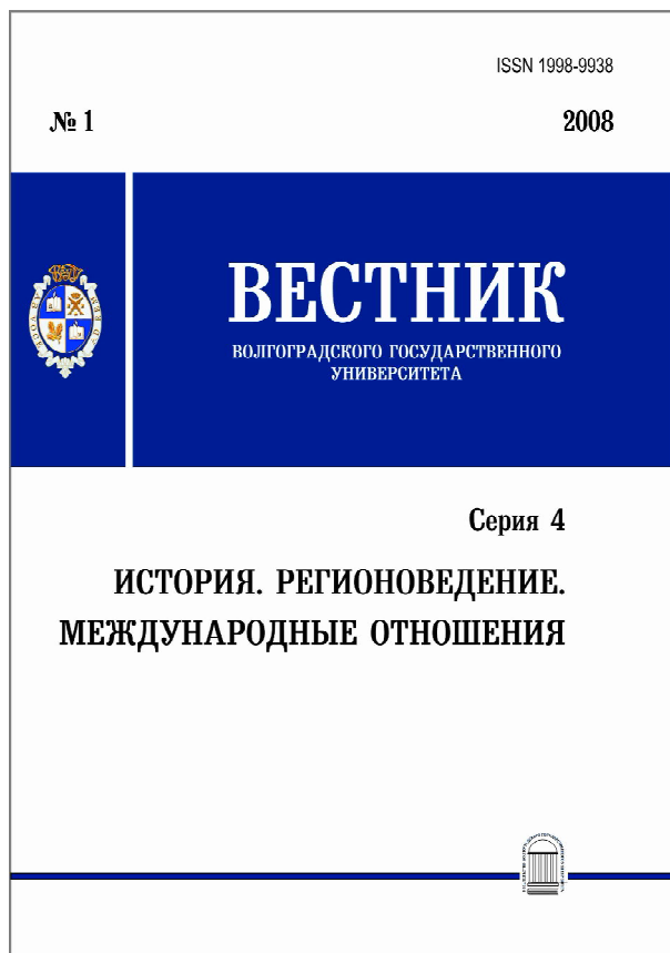
Рис. 3. Обложка журнала в период с 2008 по 2013 год Fig. 3. Cover of the journal from 2008 to 2013

дущих авторов. Безусловно, отличным решением, позволившим журналу получать статьи лучших отечественных и иностранных специалистов, стала практика выделения номеров журнала под специализированные темы. Так, были опубликованы тематические номера, посвященные 70-летию Великой Победы, археологии Евразийских степей, Крымской войне, 100-летию Великой российской революции, 75-летию Победы в Сталинградской битве, 100-летию со дня рождения российского археолога В.П. Шилова, 400-летию Смуты в России, казачеству в условиях модернизации и социокультурных трансформаций, 75-летию Победы в Великой Отечественной войне и 77-й годовщине Победы в Сталинградской битве, университетам в глобальном мире, памяти М.М. Загорюлько, политическим трансформациям в России и мире.