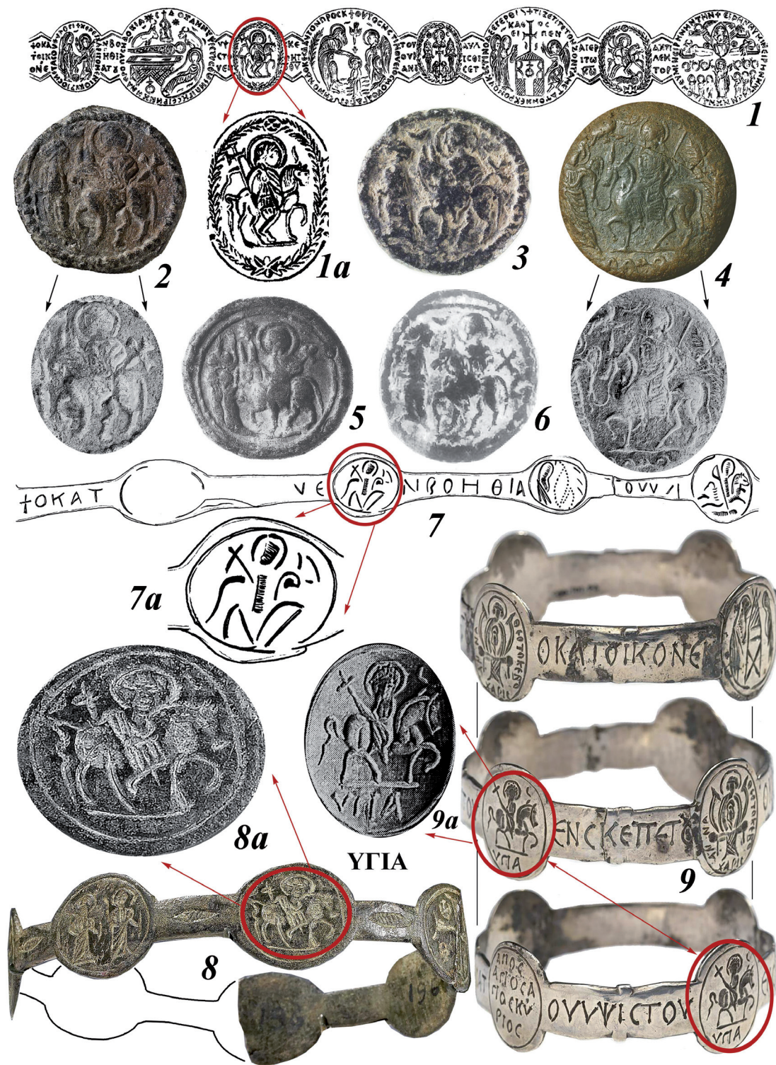
Рис. 3. Византийские браслеты (1, 7–9) и паломнические жетоны-печати (2–6) VI–VII вв. с изображением триумфального входа Иисуса Христа в Иерусалим:

1, 7–9 – Сирия; 2–6 – Сиро-палестинский регион.