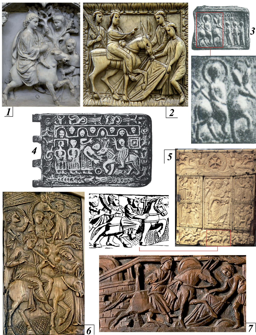
Рис. 2. Сцена триумфального входа Иисуса Христа в Иерусалим на раннесредневековых предметах: 1 – мраморный саркофаг Юния Басса 359 г., Музеи Ватикана; 2 – миланский диптих V в. из слоновой кости, Ризница кафедрального собора; 3 – оловянная амулетница, коллекция Королевского музея г. Берлина, погибшая в годы Второй мировой войны; 4 – бронзовый щиток от поясной пряжки середины VII в., меровингский некрополь Ля Бальм; 5 – оклад Евангелия из слоновой кости VI в., Национальная библиотека Франции; 6 – пластина из слоновой кости, трон архиепископа Максимиана, середина VI в., Равенна; 7 – деревянная перегородка (Lintel), Египет, VI в.; 2, 5 – [44, Nr. 119, 145, Taf. 63; 77]; 3 – [43, pl. 198, 5]; 4 – [39, p. 99]; 7 – [18, p. 502, nr. 451] Fig. 2. Scene of the triumphal entry of Jesus Christ into Jerusalem on early medieval objects: 1 – marble sarcophagus of Junius Bassa 359, Vatican Museums; 2 – Milanese diptych of the 5 th century, ivory, Cathedral Sacristy; 3 – amulet, Königliche Museen zu Berlin, destroyed during the Second World War; 4 – bronze shield from a belt buckle, the middle of the 7 th century, the Merovingian necropolis La Balme; 5 – frame of the Gospel, ivory of the 6 th century, Bibliothèque Nationale de France; 6 – ivory plate, throne of Archbishop Maximian, mid-6 th century, Ravenna; 7 – wooden lintel, Egypt, VI century