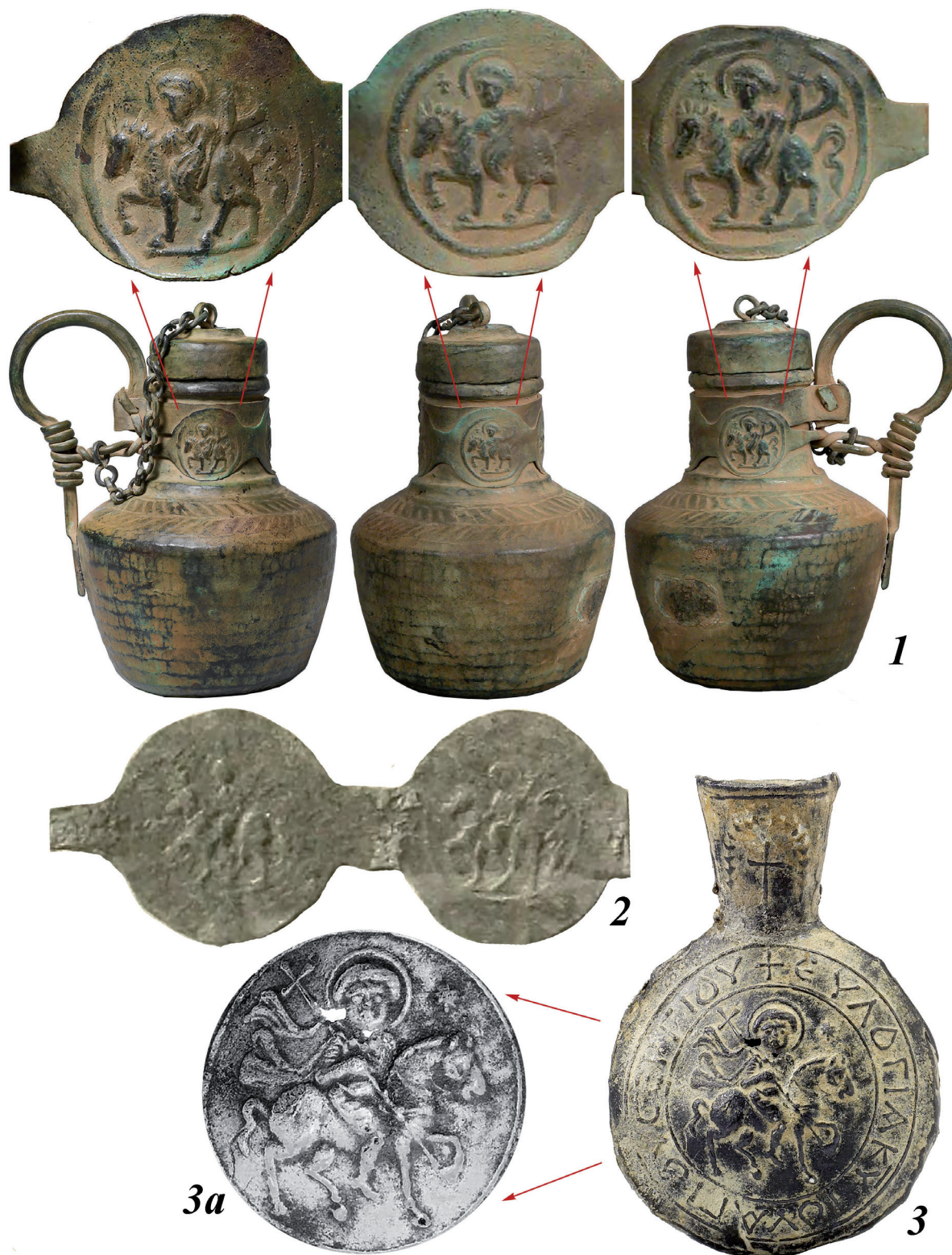
Рис. 5. Византийские кувшины (1), деталь кувшина (2) и ампула-евлогия (3) VI–VII вв. с изображением святого всадника:

1 – [21, p. 90, Kat. Nr. 57]; 2 – [46, Kat. Nr. J.6659]; 3 – [25, S. 158–159, Pl. 8a–b]