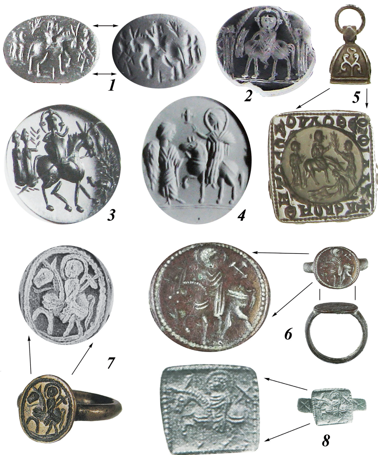
Рис. 4. Византийские геммы (1–4), подвеска-печать (5) и перстни (6–8) с изображением триумфального входа Иисуса Христа в Иерусалим: 1–4 – [38, pl. 96, nr. 675, pl. 101, nr. 708–710]; 5 – [24, S. 337, Kat. Nr. 707]; 6 – [22, p. 94, Kat. Nr. 95]; 7 – [6, с. 86, кат. № 90]; 8 – [41, Pl. 11d]