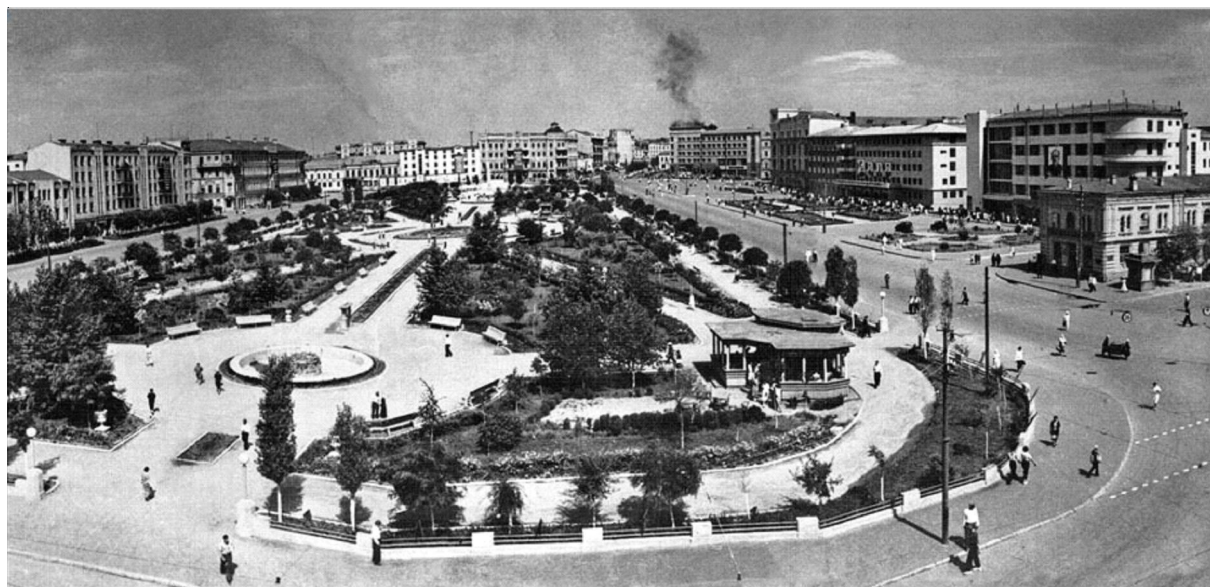
Рис. 1. Панорама площади Павших Борцов со стороны улицы Октябрьской (ныне проспект им. Ленина, обелиск воинам установлен на противоположной стороне площади), 1939–1940 гг.