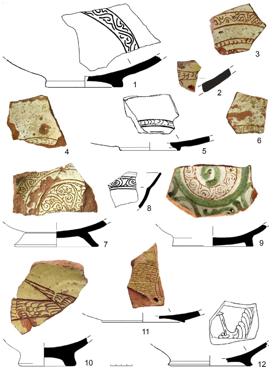
Рис. 2. Средневизантийская красноглиняная поливная керамика (Middle Byzantine Production) из раскопок в Судак. Типы FSW и PFSW :

1, 5, 8 – участок квартала 1 в северо-западной части Судакской крепости; 2, 4, 7, 9, 10 – раскоп VIII в портовой части Сугдеи; 3 – раскоп у Башни Бернабоди Франки ди Пагано; 6, 11, 12 – раскоп III в портовой части Сугдеи