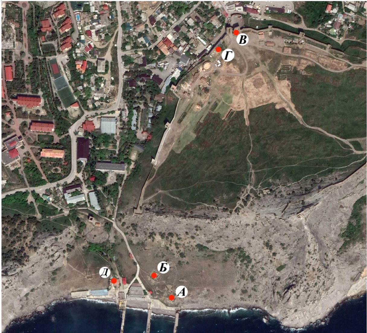
Рис. 1. Средневековое городище в Судак. Участки, на которых выявлены стратифицированные объекты XII – начала/первой половины XIII в.:

А – раскоп III; Б – раскоп VIII; Б – раскоп у Башни Бернабоди Франки ди Пагано; Г – участок квартала 1 в северо-западной части Судакской крепости; Д – раскоп IX