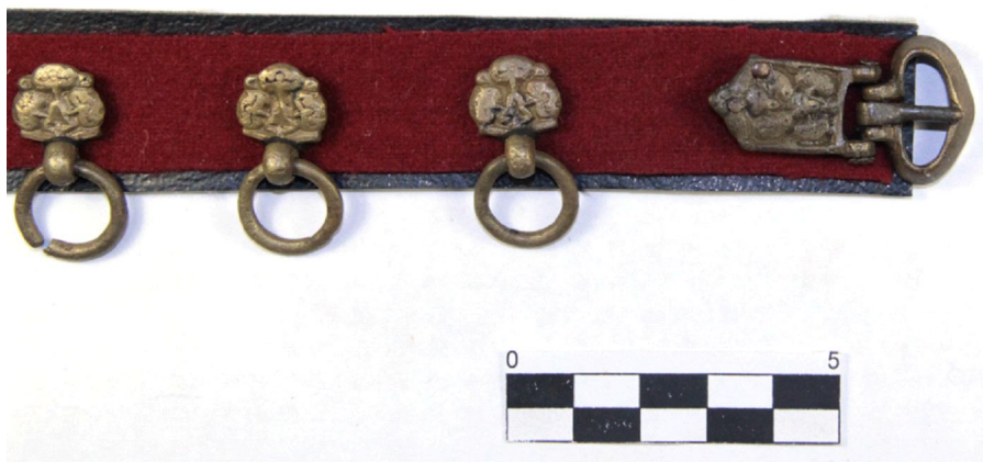
Рис. 5. Пояс № 3 (фото)