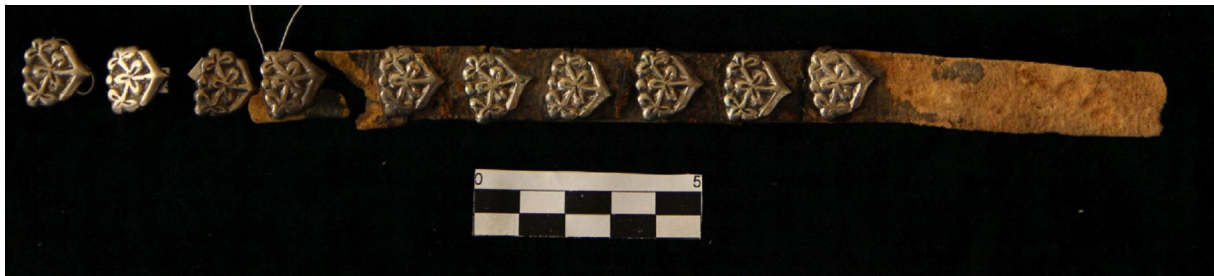
Рис. 4. Пояс № 2 – бляшки портупейных ремней (фото)