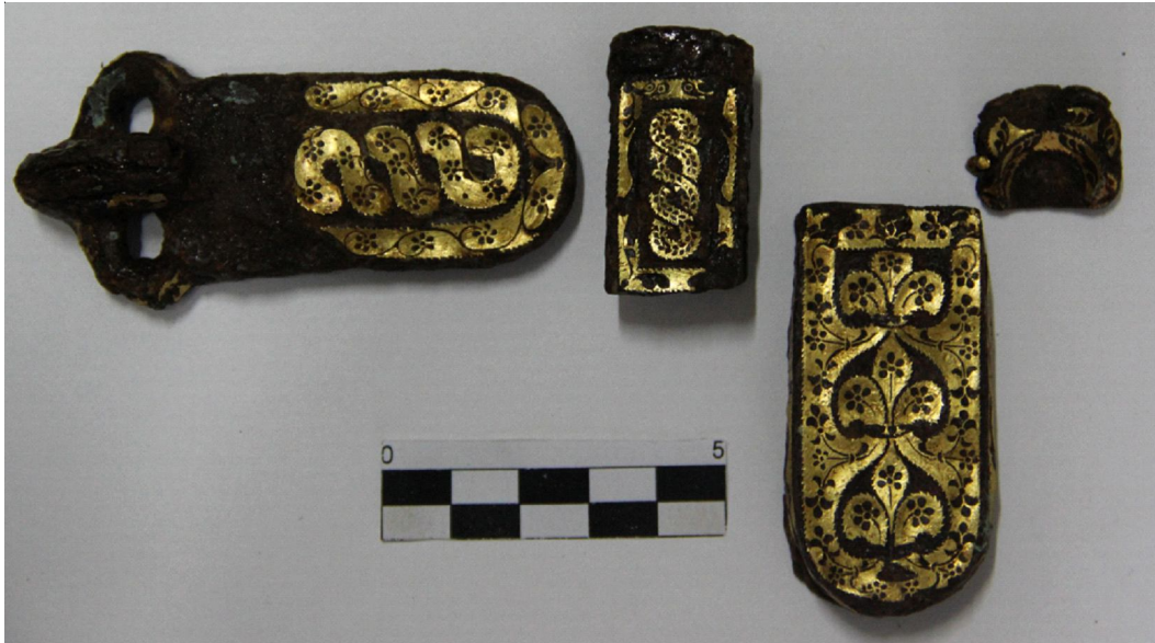
Рис. 3. Пояс № 1 (фото)