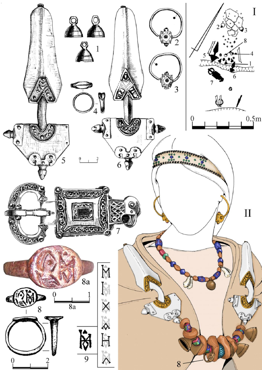
Рис. 1. Юго-Западный Крым, могильник у с. Лучистое, склеп 42. Женское погребение конца VI – первой четверти VII в. (фото, рисунок и реконструкция автора):