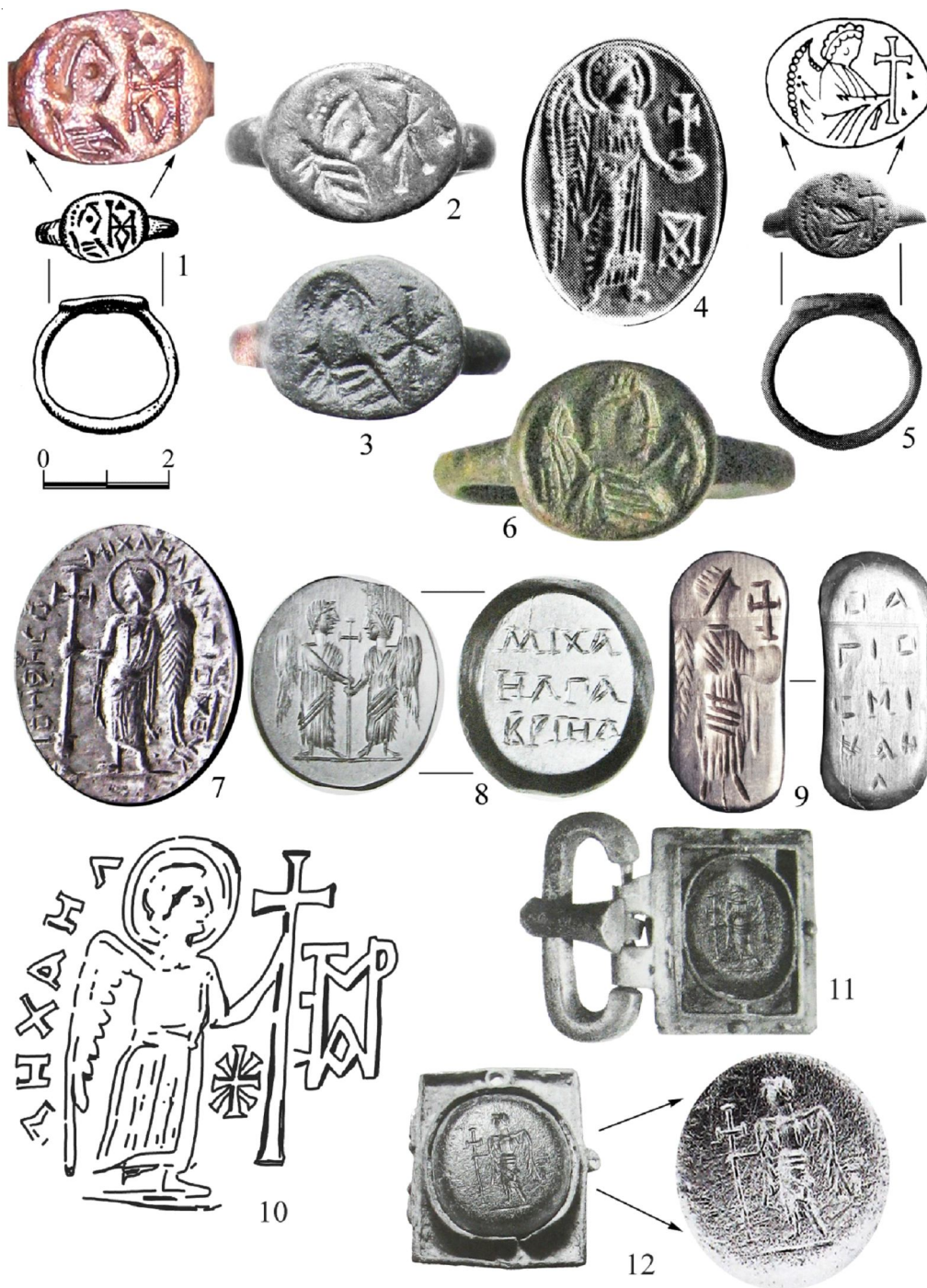
Рис. 2. Раннесредневековые предметы с профилем изображением ангела или архангела: