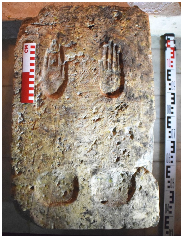
Рис. 2. Камень с изображением отпечатков коленей и ладоней в Усть-Медведицком монастыре Волгоградской области. Фото А.А. Гунько, 2016 г.