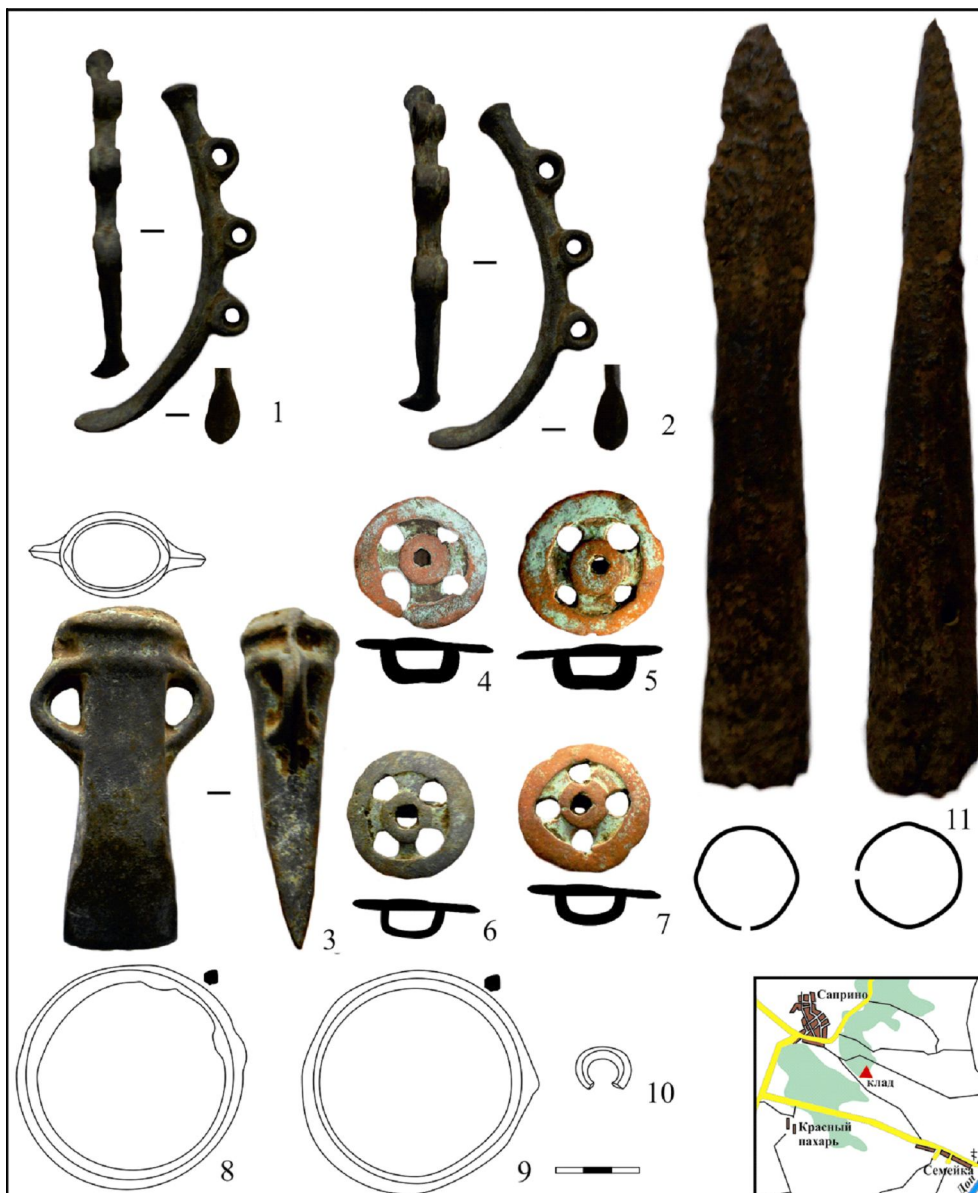
Рис. 1. Клад предметов позднейшего предскифского периода из Донского правобережья:

1, 2 – псалии; 3 – кельт; 4–7 – бляхи; 8, 9 – браслетоподобные кольца; 10 – колечко; 11 – наконечник копья; 1–10 – бронза; 11 – железо