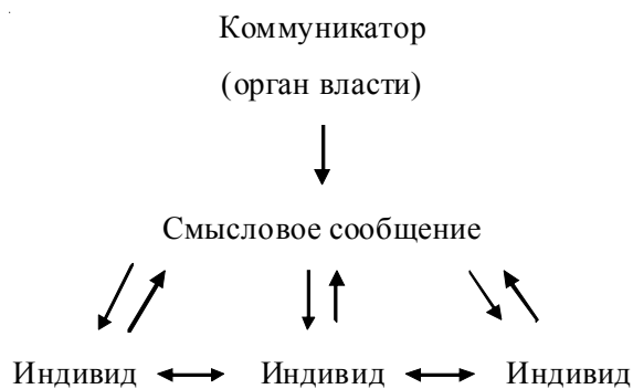
Рис. 2. Политические коммуникации в постиндустриальном обществе

В современном мире, побуждающем человека к личностному развитию, расширению и диверсификации социальных контактов (хотя бы в виртуальной форме), граждане уже не могут удовлетвориться ролью пассивного потребителя генерируемой органами власти информации. Теперь поступающие от власти идеологии активно обсуждаются и критикуются на уровне сетевого взаимодействия граждан вне поля традиционных СМИ, социальная сеть вырабатывает свою картину мира, зачастую не совпадающую с официально рекомендованной (рис. 2). Многочисленные запреты и предписания, даже на уровне уголовного законодательства, не могут остановить данный процесс гражданских коммуникаций.