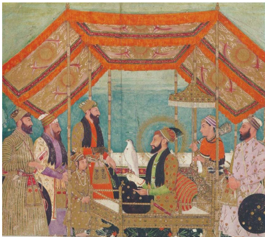
Рис. 3. Миниатюра из поэмы «Шахнаме» Фирдоуси Fig. 3. Miniature from the poem Shakhnama by Ferdowsi

На одной из персидских миниатюр, которая иллюстрирует поэму Фирдоуси «Шахнаме» (XII в.), правитель восседает, поджав ноги, в центре квадратного столика на ножках, ограниченного невысоким бортиком, который по углам соединен четырьмя невысокими шестами, возвышающимися над этим сооружением. Верх шестов стягивает тонкий канат. С одной стороны он имеет перемычку для входа внутрь пространства (рис. 3). Не исключено, что иранская традиция помещения человека в квадратное пространство мира могла уходить в глубь веков. Территория Хазарского каганата делилась на неравные квадраты, в самом меньшем из них жил каган Иосиф [17, с. 11]. По данным Иосифа, размер Хазарского домена равнялся: на восток 20 фарсах, на юг – 30 фарсах, на запад – 30 фарса-