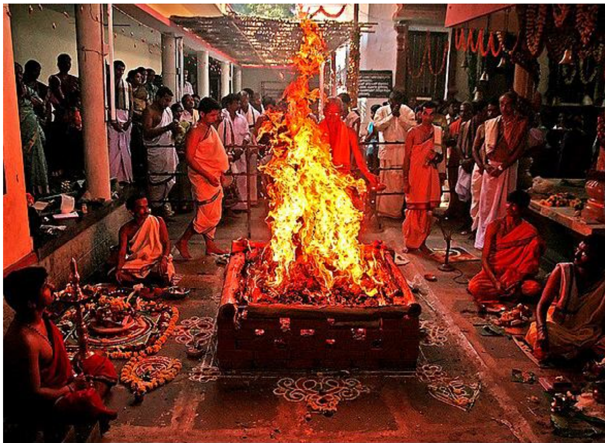
Рис. 4. Зороастризм. Помещение с культовыми атрибутами