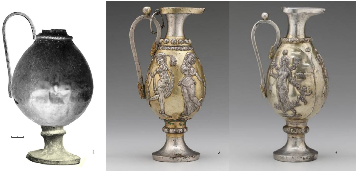
Рис. 1. Сасанидские сосуды:

1 – Назаров, реконструкция; 2, 3 – целые сасанидские кувшины