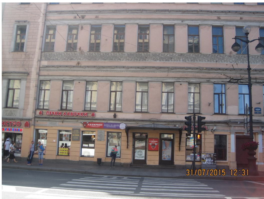
Рис. 4. Фотомагазин Ф. Иоахима – Санкт-Петербург, Невский проспект, 3 Fig. 4. Photoshop of F. Ioahim – Saint Petersburg, Nevsky Prospect