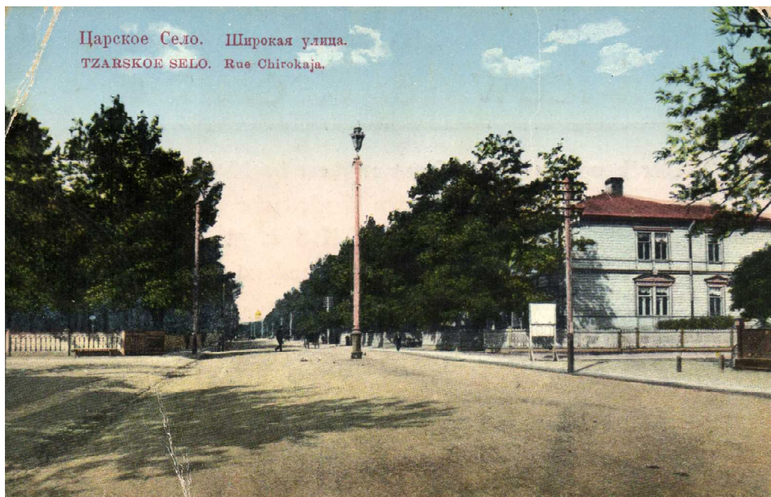
Рис. 3. Фотосалон К.Е. фон Гана – Царское село, ул. Широкая Fig. 3. Photostudio of K. E. fon Gan – Tsarskoe selo (Tsar Village), Shirokaya St.