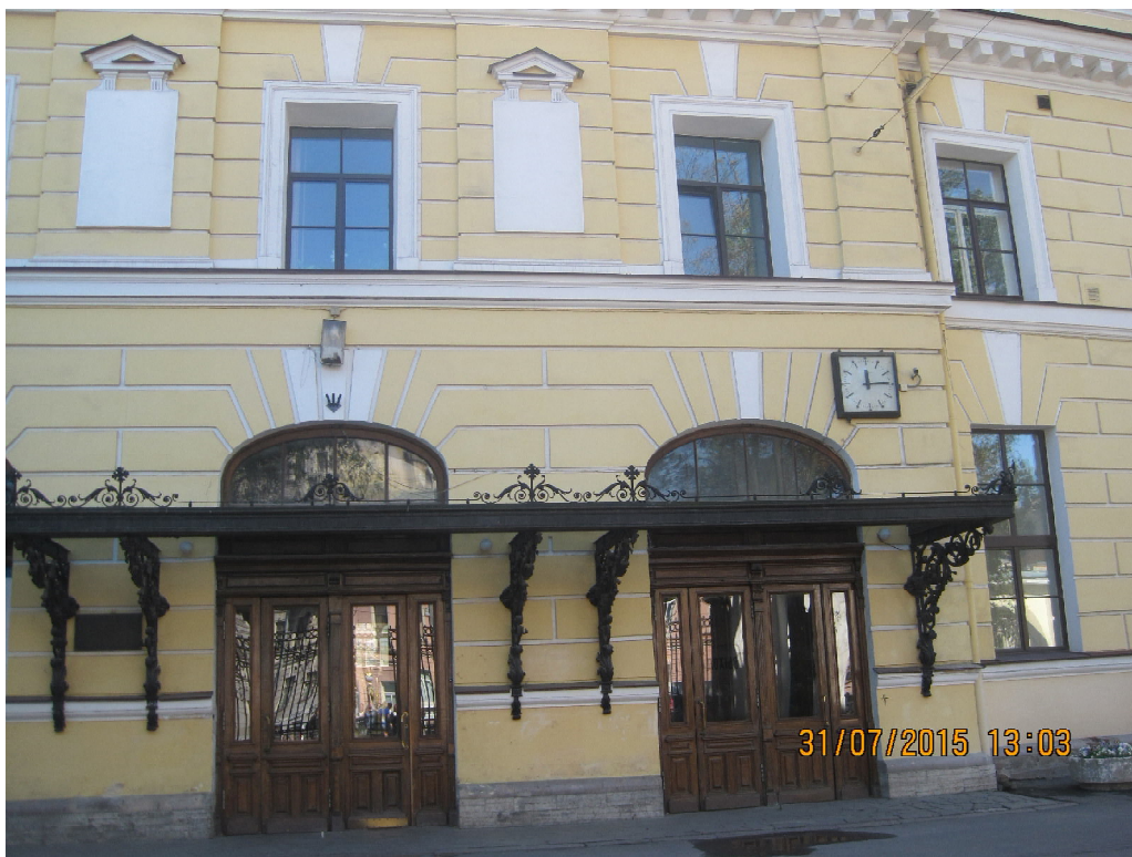
Рис. 2. Здание Учетно-судного банка – Санкт-Петербург, Екатерининский канал (канал Грибоедова), 30/32