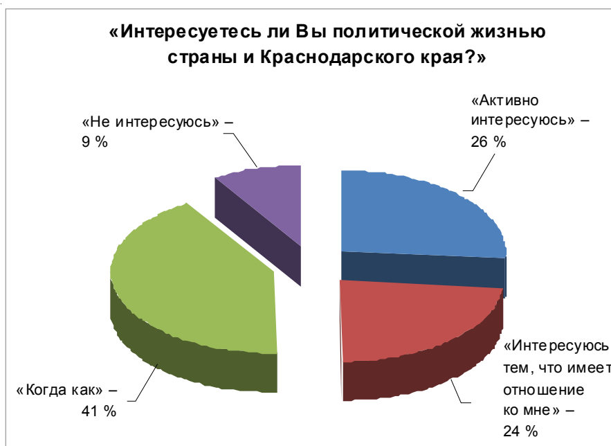
Рис. 1. Распределение респондентов по степени интереса к политической жизни страны и Краснодарского края

В данном контексте необходимо проводить системные исследования потребностей и интересов молодежи, заниматься ее просвещением и привлечением к решению имеющих-